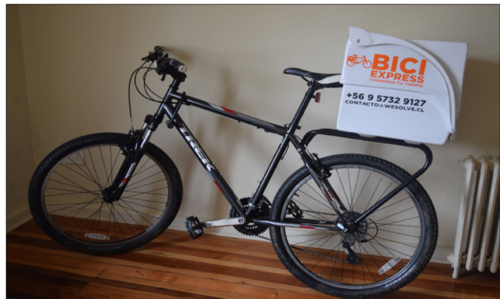
Los bicimensajeros usan tres bicicletas como la de la fotografía para transportar pedidos en Concepción. Es el servicio ecológico y amigable con el medioambiente.