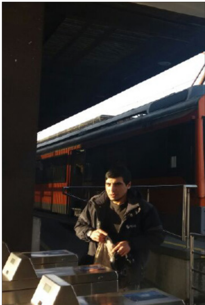
La aplicación móvil ayuda a los usuarios a prevenir accidentes que podrían llegar a ser fatales, contribuyendo a que sea un medio de transporte seguro.

El mercurio es un metal que provoca cambios de carácter y ansiedad en las personas. Y más aún, altera el sistema inmunológico, el sistema genético y el sistema enzimático.