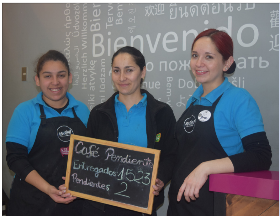
Las funcionarias de Rendibú se preocupan de atender a los beneficiarios con dedicación y una gran sonrisa para que sientan que el café que le dejaron pagado fue un gesto cálido.