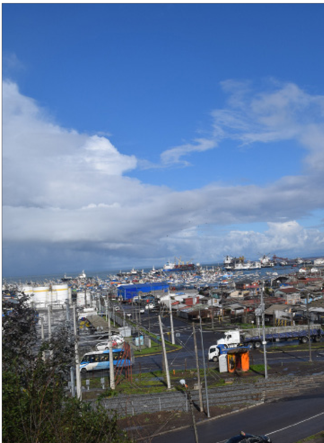
Coronel es una zona saturada por la contaminación de varios focos contaminantes. En el frente: camiones transportistas y locomoción colectiva. En el fondo: industrias, puerto y termoeléctricas.

"Coronel, Huasco y Puchuncaví son las 3 comunas de Chile que están consideradas como zonas saturadas".