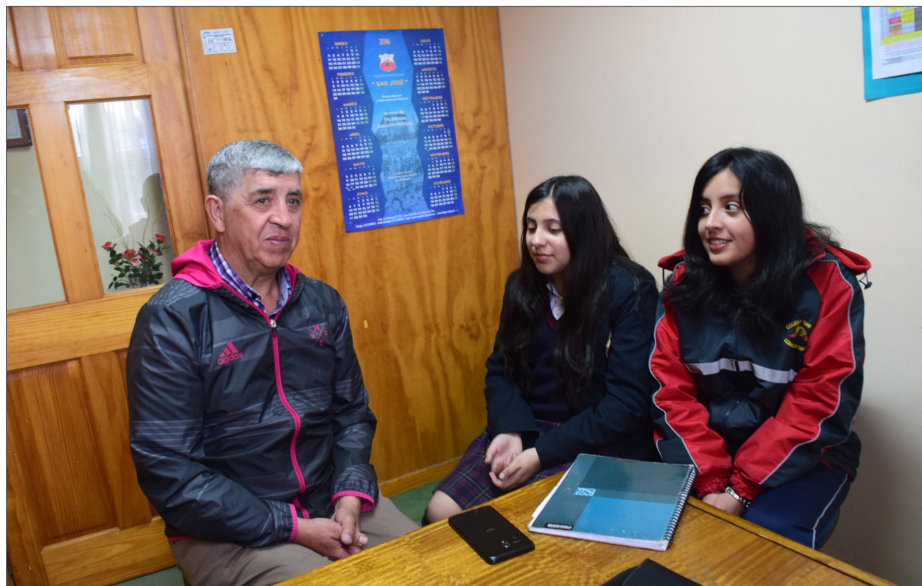
Forma parte de la Mutual de Ex Jugadores de Deportes Concepción que desde 2015 funciona en San Martín 851. Esta iniciativa es única en Chile y busca gestionar proyectos que puedan apoyar económicamente a los ex jugadores que tengan dificultades.

Creo que las dos profesiones han jugado un papel importante en mi vida. En las dos tuve logros maravillosos que me hicieron crecer como persona, me enseñaron a ser honesto, solidario, responsable y empático, valores que hasta el día de hoy sigo cultivando.