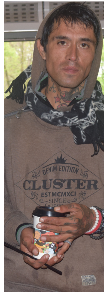
Quienes lo necesitan leen la pizarra para ver si hay un café pendiente.

En los distintos locales están las pizarras que cuentan los cafés y ayudan a que cada día sean más los penquistas que se enteran de esta iniciativa mundial y se ponen al día con la solidaridad.