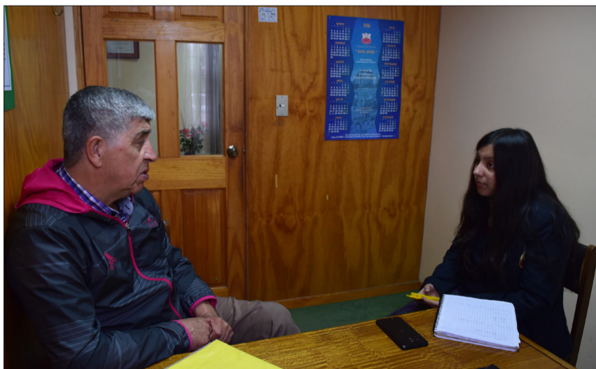
Jubiló como Profesor Básico hace nueve años después de 40 años de docencia, una larga trayectoria dedicada a educar a niñas y niños que ya son madres y padres.

Después del triunfo de Ñublense, me fui a mi casa a esperar que me llamaran. Pero no ocurrió. En ese tiempo uno no tenía un representante que tomara ese tipo de decisiones; uno decidía sin consultarle a nadie. En mi caso, debía decidir lo mejor para mi familia, pues y me había casado. Así que me devolví a Concepción y recuperé mi trabajo: seguí haciendo las clases de Educación Física en el San Agustín. Paralelamente trabajaba en la Escuela Marina de Chile, realizando las clases de todas las asignaturas desde primero a cuarto año básico.