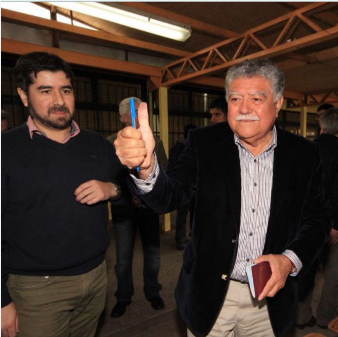
Entre los 485.008 votantes cambiados de domicilio por el Registro Civil estuvo Audito Retamal Lazo, alcalde de San Pedro de la Paz, que tuvo que sufragar en el Liceo Industrial de Concepción, comuna aledaña a la que él postuló y en la que ganó la reelección.