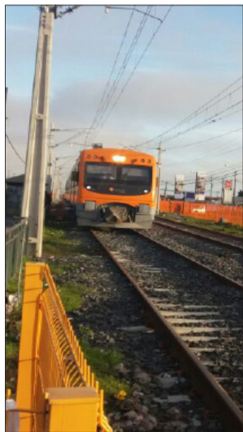
Ya se hace uso de la nueva extensión de la línea férrea hacia Coronel.