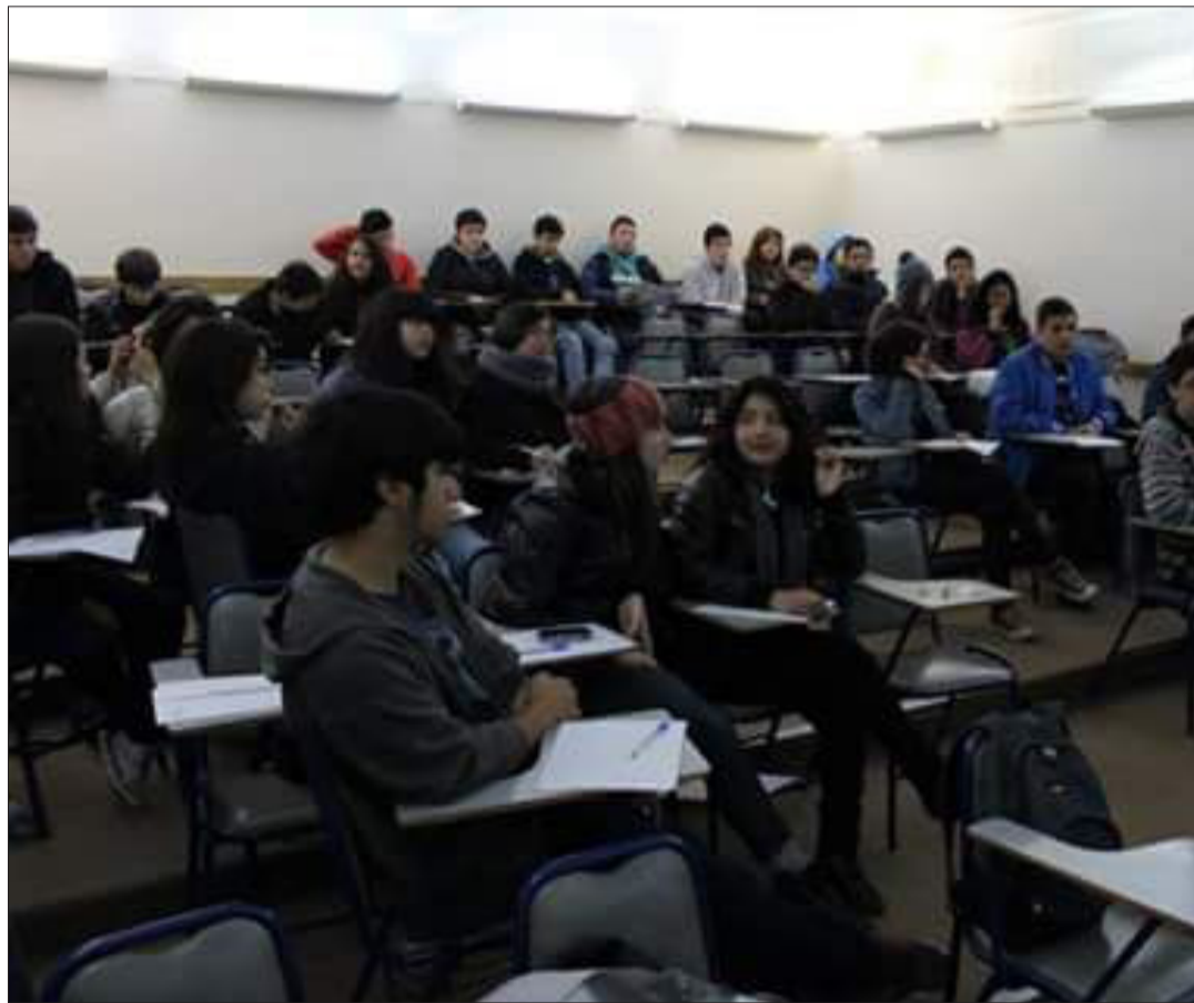
Estudiantes de enseñanza media, en una clase de Literatura y Creatividad en la Pontificia Universidad Católica de Valparaíso.

El programa es financiado por medio de becas que otorgan las municipalidades de dichas