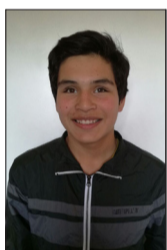
Por Juan Pablo Castillo Sepúlveda

Como los mayores flujos de tránsito peatonal se ubican en calles cercanas a los centros comerciales, ellas generalmente están habilitadas correctamente para el uso de personas con discapacidad. Pero existen calles con una concurrencia similar, igual o mayor, que simplemente no están habilitadas para el uso seguro de personas con otras capacidades. Esto les genera grandes problemas de movilización. Por ejemplo: en distintas calles de la ciudad se pueden encontrar vías en las cuales los desniveles por los que podría pasar una silla de ruedas están mal hechos, están dañados (ya sea