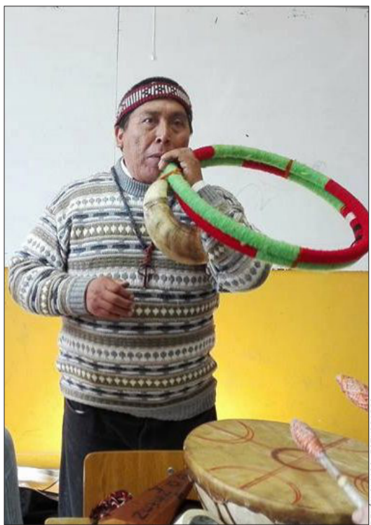
El longko dictando una clase de música mapuche en el Liceo Artístico de Quilpué.