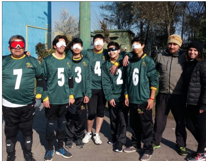
Equipo de golbol "Club Gladiadores de Quilpué", luego de un partido disputado en la ciudad de Santiago.

Actualmente, el golbol es un deporte ampliamente difundido en el mundo y cuenta con su propio Campeonato Mundial, versionado por última vez en 2014 en Finlandia, donde resultaron ganadores Brasil en la categoría masculina y Estados Unidos en la femenina. A nivel paralímpico, luego de ser deporte de demostración en los Juegos de Heidelberg 1972, se integró oficialmente al