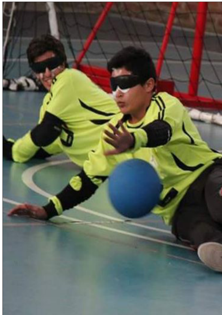
Gladiadores de Quilpué en un partido oficial del Torneo de la Liga Nacional de Golbol de Chile.

Conseguir la implementación necesaria, en cambio, fue más difícil. Al comienzo, además de recibir donaciones, tuvieron que hacer bingos y rifas para conseguir los balones e indumentarias deportivas. Pero su entusiasmo les ganó notoriedad en la comuna, hasta que el municipio quilpuense les entregó no sólo el espacio en que hoy entrenan, sino también sus uniformes deportivos. Gracias a su tenacidad, los