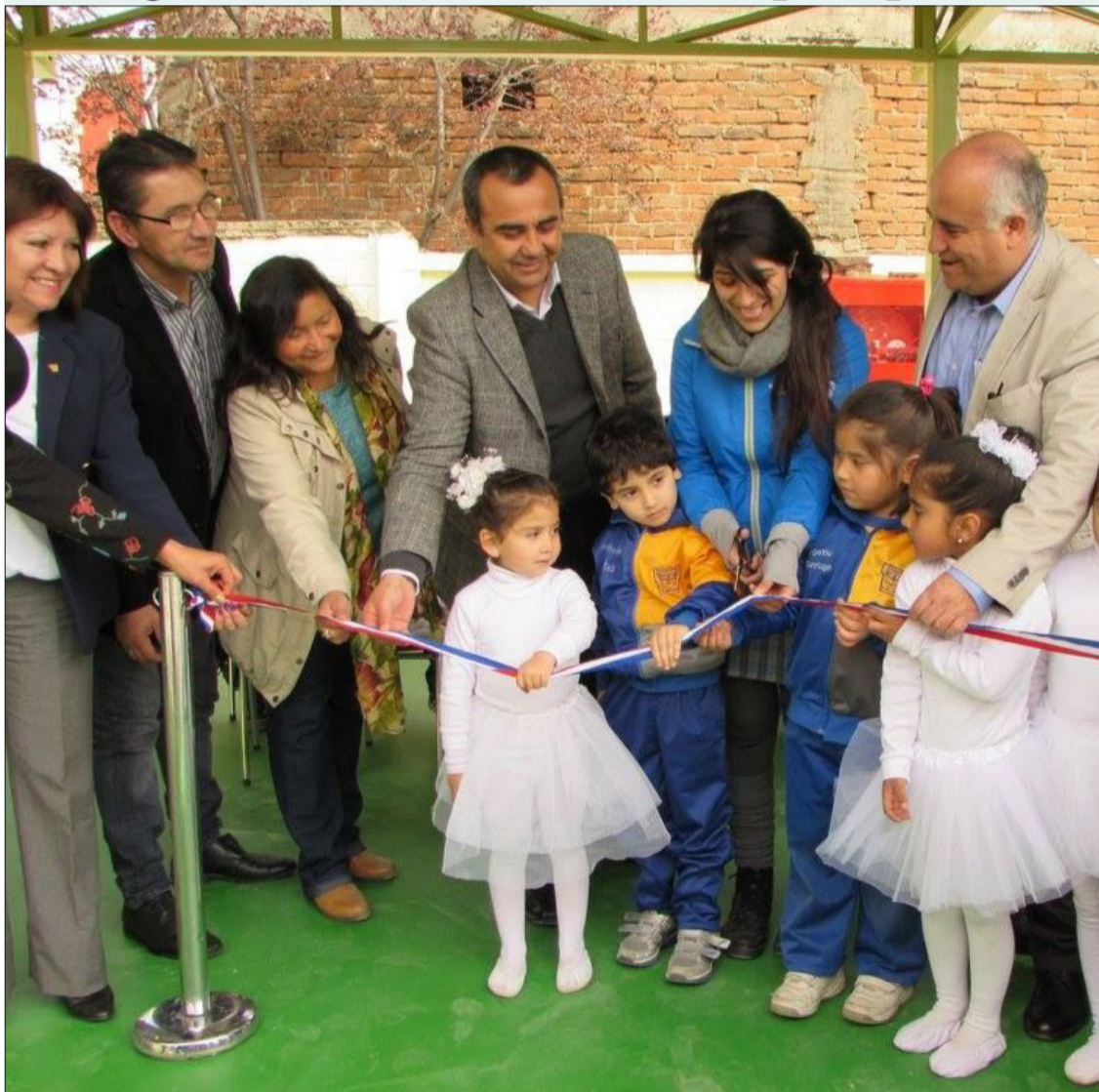
El alcalde de Quilpué, Mauricio Viñambres, entregó las obras de remodelación de la Escuela G. Guillermo Zañartu. Los trabajos consideraron una inversión de 49 millones de pesos, destinados a implementar salas acondicionadas con baños, medidas de seguridad contra incendios y un patio techado.

Por iniciativa de un grupo de académicos: