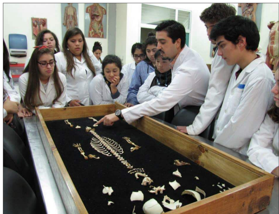
Estudiantes de enseñanza media del programa BETA en una clase en la Temporada Académica de Verano en la Pontificia Universidad Católica de Valparaíso.

La oferta atractiva de cursos y talleres están enfocados en habilidades de nivel superior y son elegidos por los estudiantes de acuerdo a sus propios intereses.