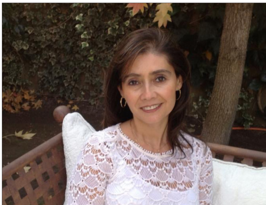
LECTURA DE FOTO.— diestia etravoliam, nes menatum atque terevis diem ore, consint rionte ave, quondam ortem popubicae nos, videsinatque vehenat imussimus.