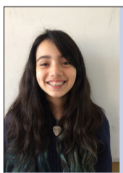
Por Valeria Cortez

Los artistas callejeros son personas que encontraremos diariamente en nuestra ciudad. Hay mucha gente que sabe convivir con ellos, pero existen algunos que realmente no pueden soportarlos... ¿Cuál es la inspiración de estos artistas? ¿Qué los motiva a seguir adelante?