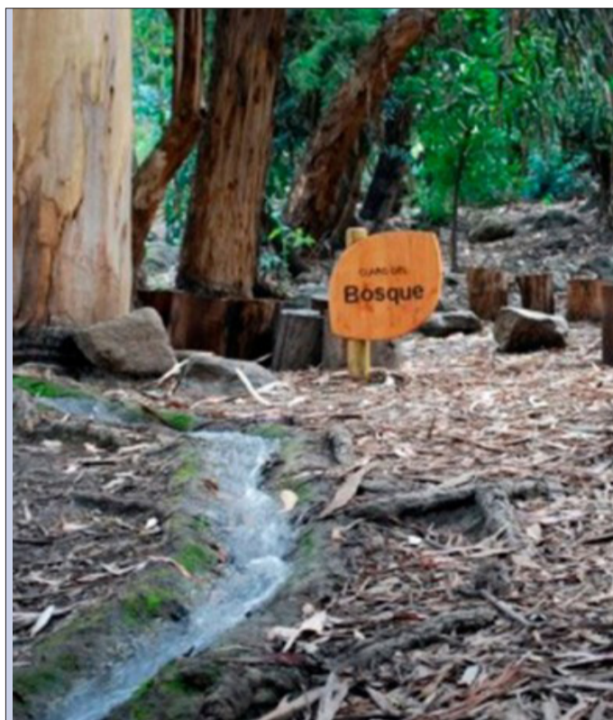
Cartel de madera de tamaño pequeño ubicado en el bosque escondido, indica en la palabra "Bosque", hacia adentro se ve la variada flora.

pueden correr, crear historias, su imaginación se enciende al instante en que llegamos a ese lugar tan mágico".