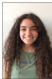
Por Arantza Martínez

La Municipalidad de Huechuraba recientemente ha comprado un colegio particular subvencionado, para así transformarlo en una escuela pública. Debido a esta acción se ha convertido en la primera comuna del país, durante los últimos 30 años, en realizar este considerable cambio.