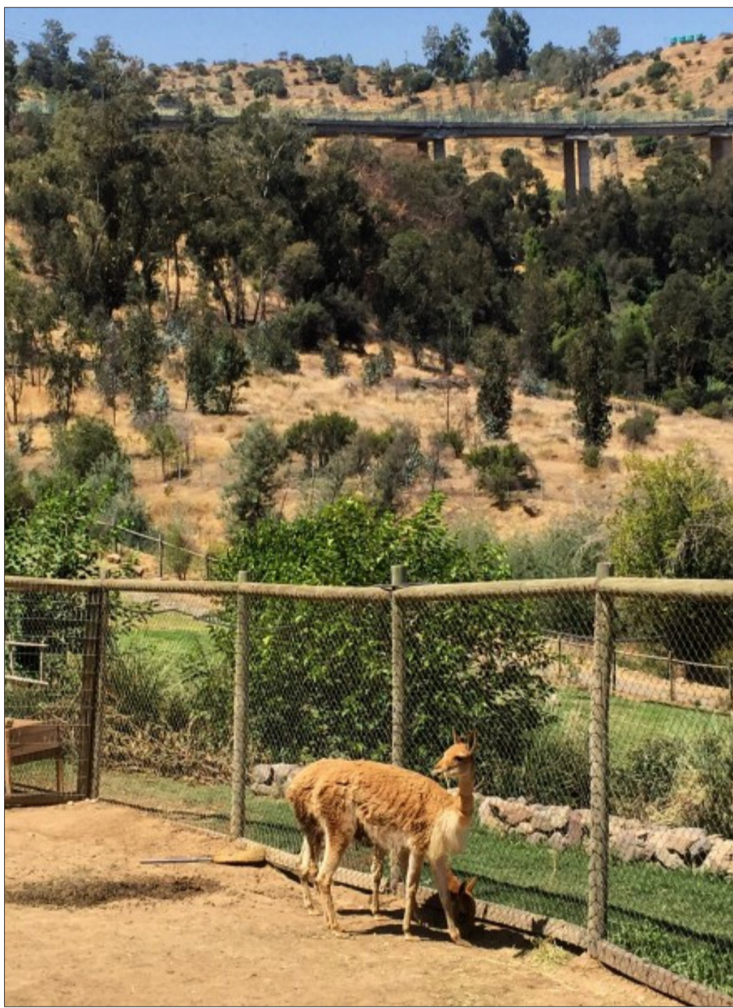
Animal comiendo dentro de un recinto que se ubica en el bosque de Huechuraba.