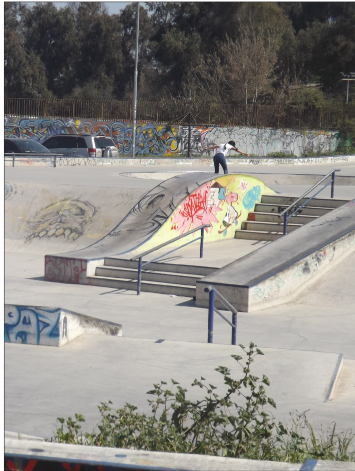
Skatepark del polideportivo, donde normalmente se encuentra poblado de adolescentes andando con sus skateboards.

La edificación también incluyó con la remodelación de dieciséis multicanchas de la comuna, la construcción de un skate park, el