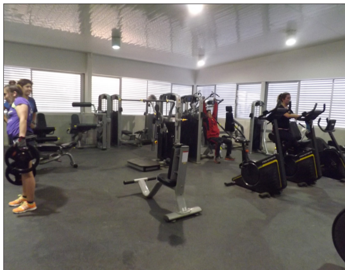
Sala de musculatura, donde hay todo tipo de máquinas para todas las partes del cuerpo, todo esto es gratuito si usted forma parte de la comuna

CARLOS VALENZUELA, ADMINISTRADOR DEL LUGAR, también aprovecha las distintas disciplinas que ofrecen las instalaciones del polideportivo y co-