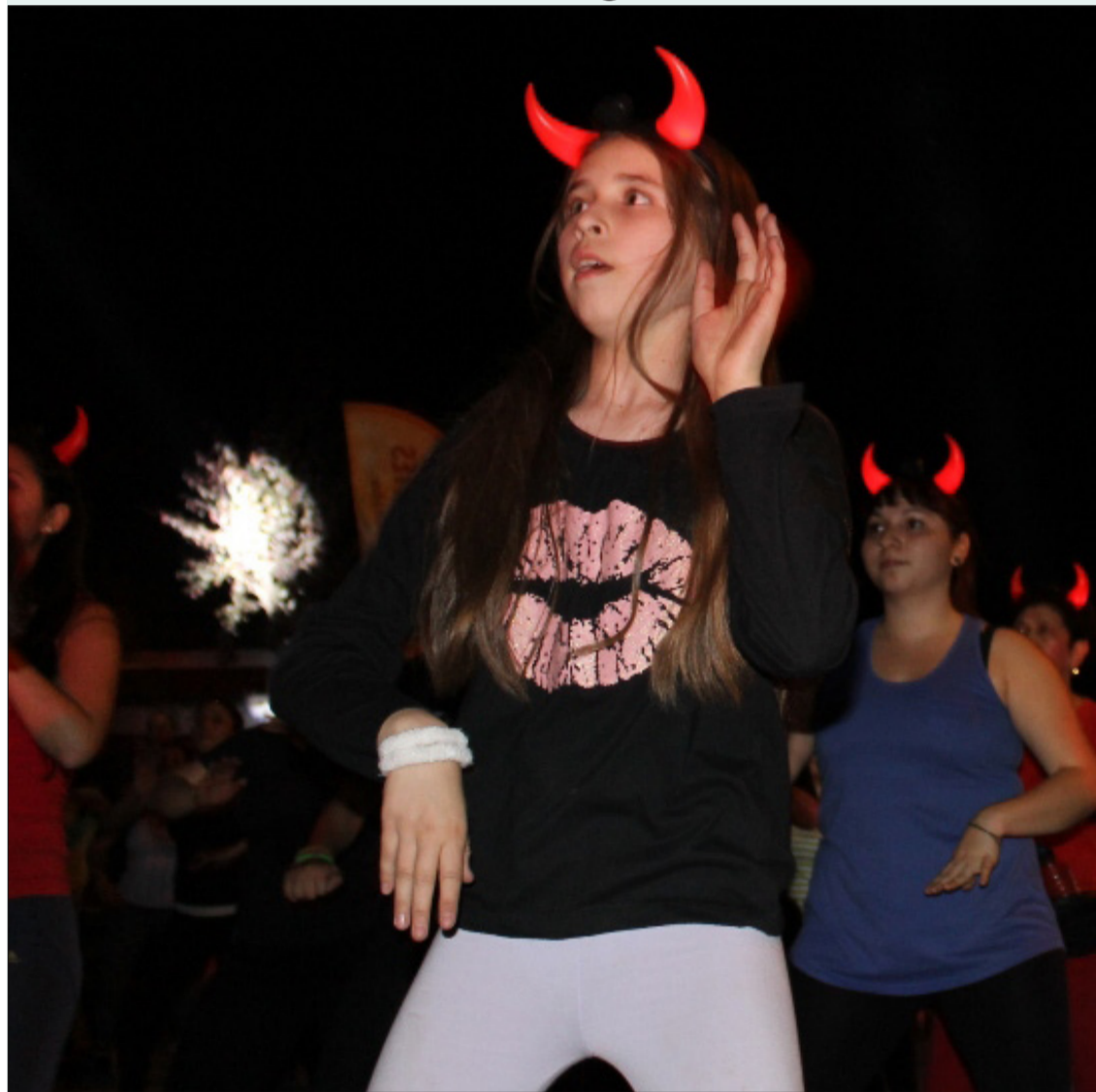
La noche de halloween se celebró a lo grande en la comuna de Huechuraba, realizando una maratón masiva de zumba. Esta se llevó a cabo en el sector de Los Libertadores en donde personas de todas las edades disfrutaron por mas de dos horas de esta actividad deportiva.