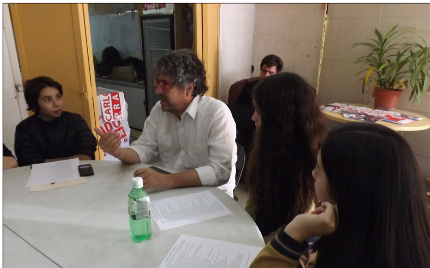
El equipo de Tierra de Pumas Jr con el alcalde, abrazados después de terminar la entrevista.

Hoy en día las cosas son muy diferentes, se generan discusiones sin argumentos. Alguien no sabe, el otro tampoco y se acabó el debate. Ya, listo, chao.