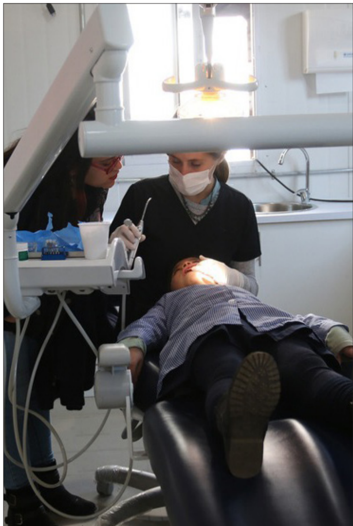
Especialistas de odontología realizando un chequeo a una alumna en la unidad fija de Huechuraba.