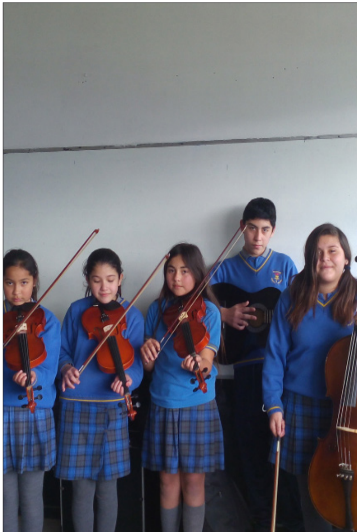
Algunos alumnos en la sala de música de quinto, séptimo y octavo año pertenecientes al Taller de Cuerdas de la Escuela Villa Jesús.