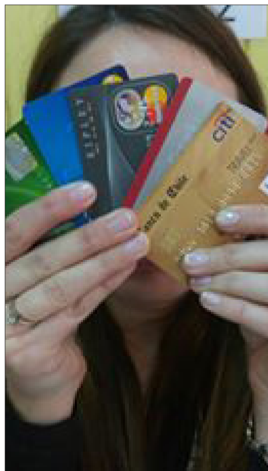
La necesidad de adquirir puede llegar a provocar un serio problema psicológico.