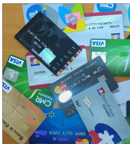
La adquisición de muchas tarjetas provoca sobreendeudamiento.