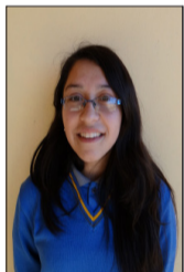
Por Daniela Pérez Puentes

Hace poco tiempo observé el vídeo de un hombre que ponía una cuerda alrededor del cuello de un perro callejero y la unió a la camioneta en movimiento. Mientras el can intentaba soltarse, las ruedas aplastaban sus patas y se ahorcaba, sin poder defenderse siquiera, sin que el conductor detuviera su marcha, fue en verdad una triste escena. Al finalizar quedé muy impactada, a la vez muy preocupada, y me hice esta pregunta ¿hasta qué punto puede llegar la crueldad de un ser humano? Siempre me han enseñado que las personas utilizan la razón, que es lo que nos diferencia de las otras especies. Después de ese día comencé a cuestionarme y ver las cosas desde otro punto de vista. En mi ciudad, el maltrato animal parece ser común para muchos, todos los días veo como perritos callejeros son echados a patadas de todo lugar, solamente por buscar comida o refugio por el frío. A nadie