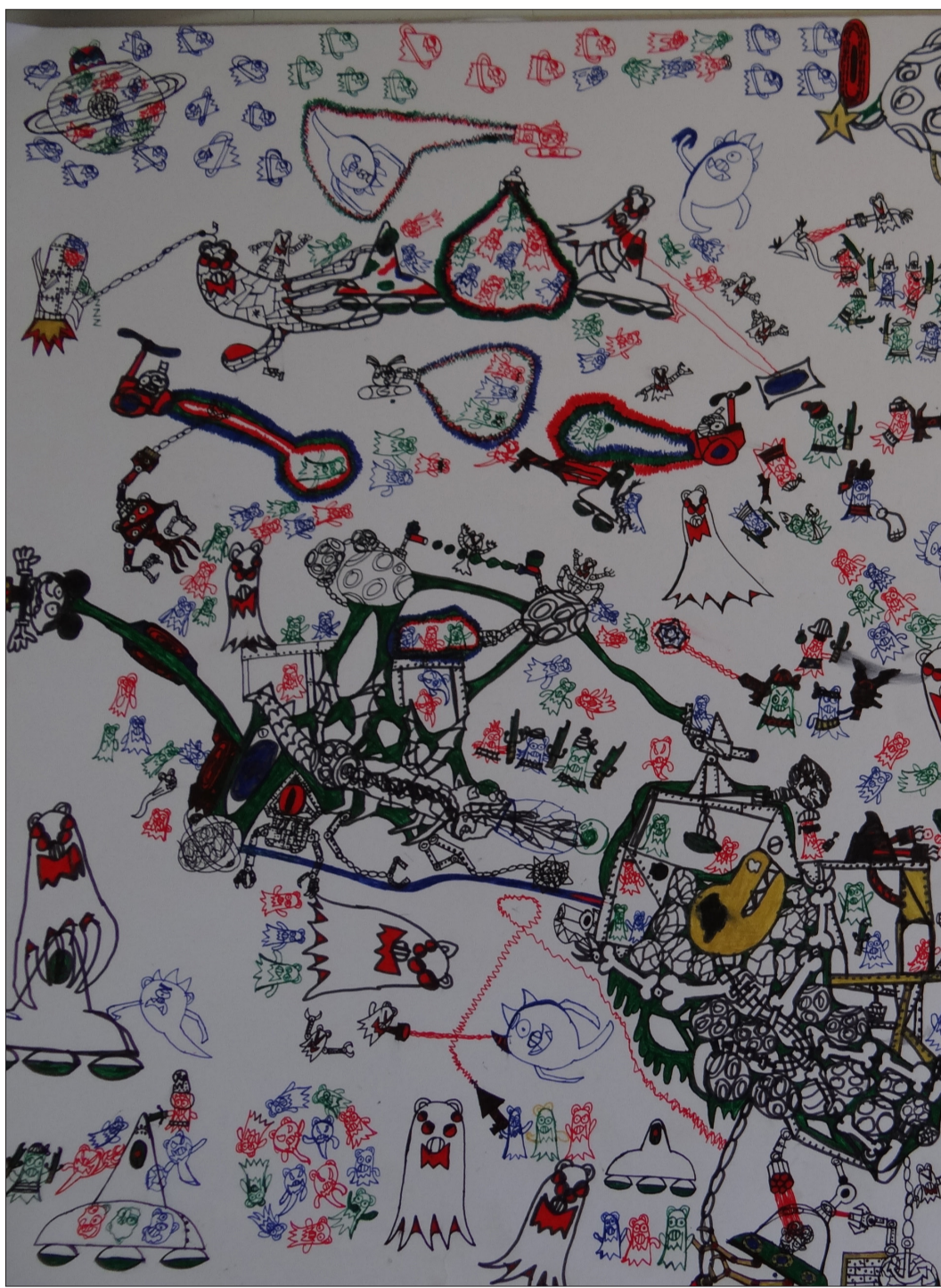
Dibujo de alumno que presenta trastorno de Asperger, usando técnica de block y lápices de pasta.

Para muchas familias con niños especiales, conseguir que la sociedad permita la inclusión no es una tarea fácil por la falta de información.