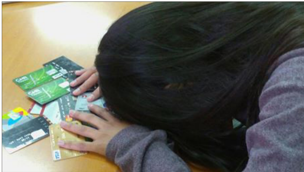
EL Consumismo desmedido tiene a miles de chilenos endeudados, preocupados y con problemas a la salud mental.

El doctor Javier Garcés, psicólogo, técnico del Programa de la Unión Europea sobre Adicción al Consumo y Sobreendeudamiento, citado en el estudio realizado por DEmedicina, salud y bienestar, señala que existen tres tipos de adicción: "adicción a la compra, que consiste en el consumo como pilar sobre el que se sustenta la vida diaria y que ocupa todo el tiempo disponible; adicción al consumo o afán