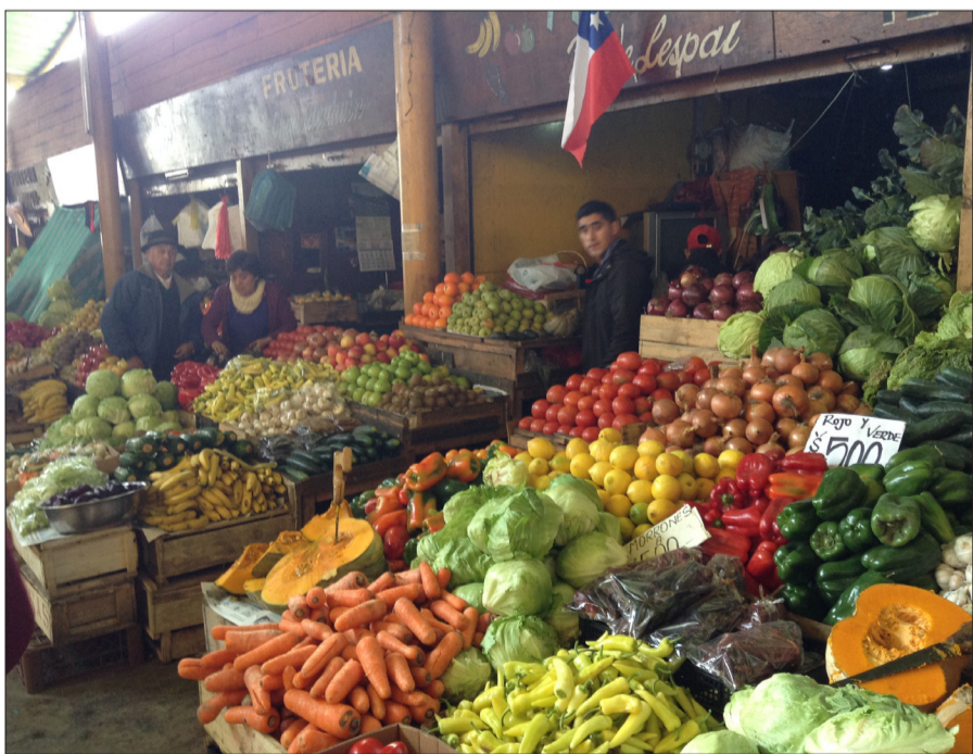
Fotografía panorámica de la ubicación y distribución de los comerciantes de la Feria Rahue en la actualidad.