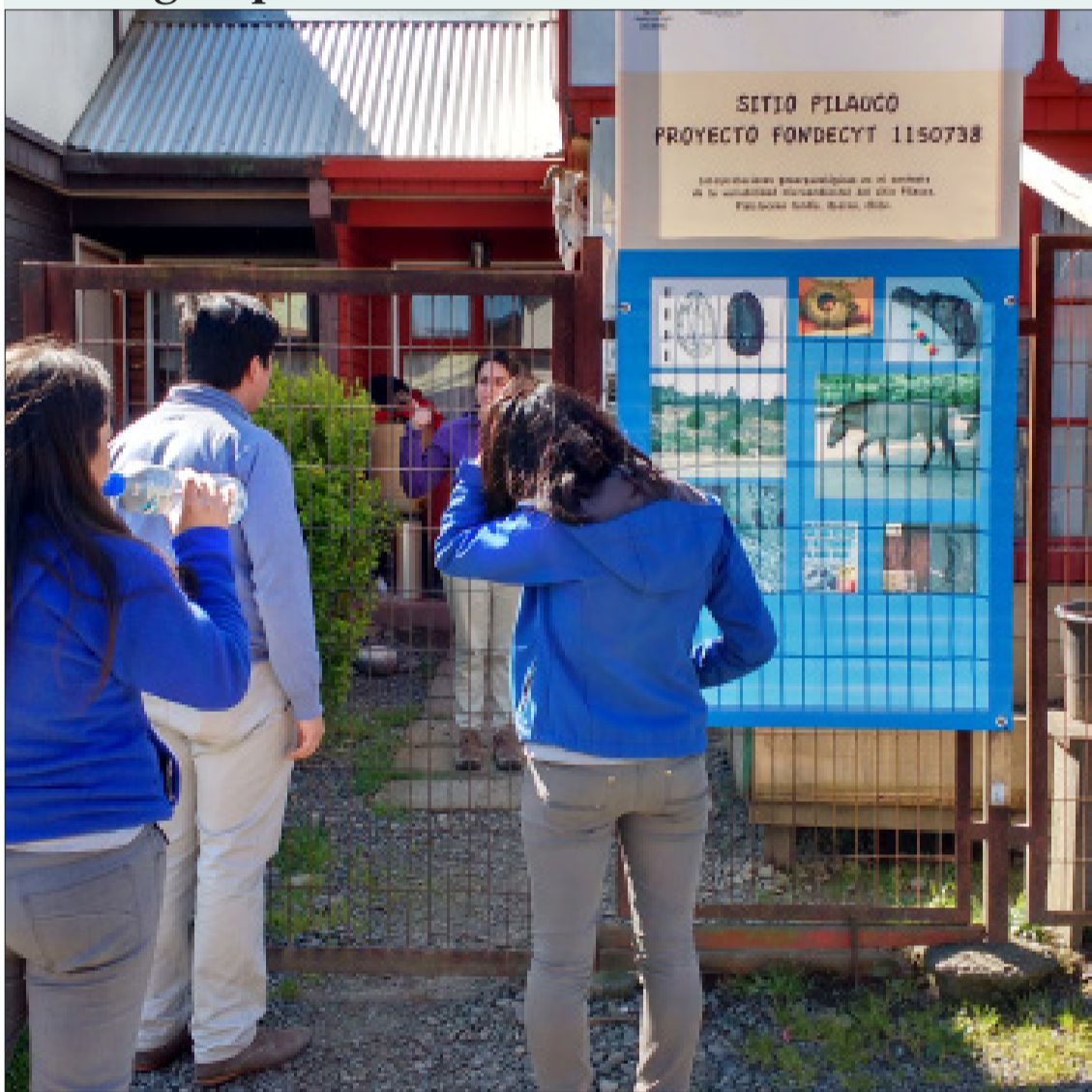
En el sitio arqueológico donde se encontraron los restos del gonfoterio y otros animales pertenecientes al período Paleolítico, Sernatur y la Ilustre Municipalidad de Osorno han desarrollado un programa de visitas asistidas para establecimientos educacionales que busquen enriquecer la experiencia educativa