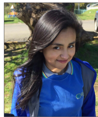
Columna de Valentina Soto Astorga.