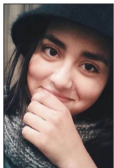
Por Valentina Soto Astorga

No tuve oportunidad de debatir con mis padres cuando decidieron empezar una nueva vida en Osorno; de la capital de Chile al Sur Austral, de la gran manzana al campo, de la civilización a la "horrible ruralidad", como pensarían algunos.