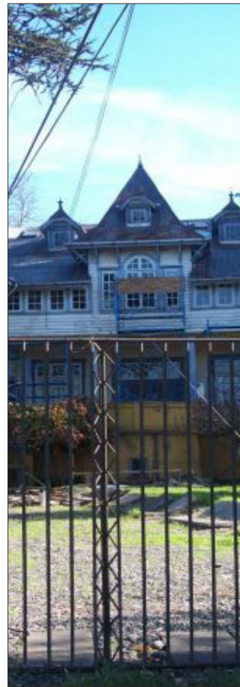
Casa Hollstein, hoy perteneciente a la Universidad de Los Lagos.