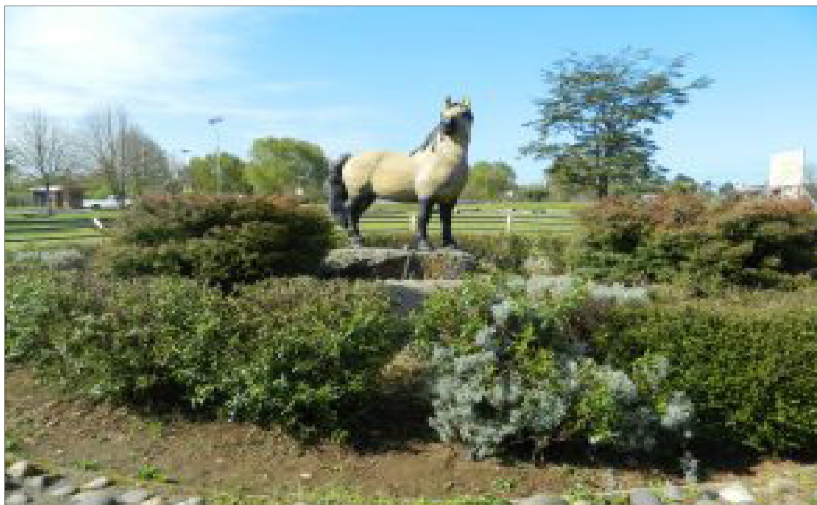
Estatua representativa de la fauna que habitaba el sector de Pilauco hace millones de años atrás, ubicada en el Parque Pleistoceno Chuyaca circundante al lugar del hallazgo.