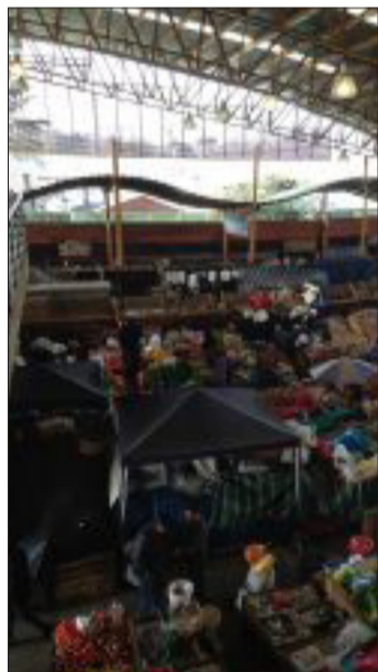
Foto panorámica de la distribución de la Feria Rahue en su totalidad.