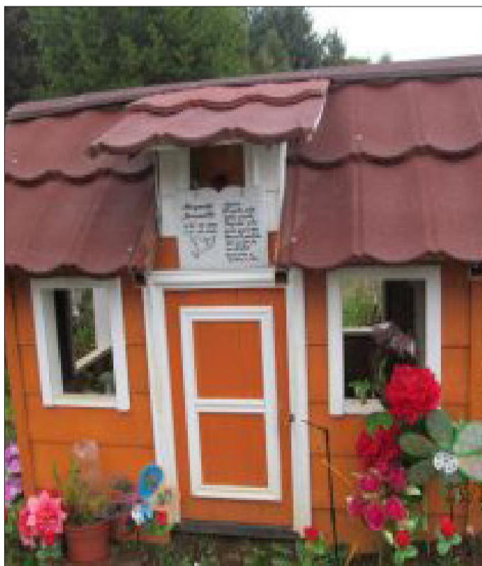
Una de las tumbas ubicadas en el cementerio, similar a una casa del sector, en la cual descansa una de las vecinas de la localidad.

to entre lo sagrado y lo terrenal, es un espacio transformado por una visión de la muerte distinta a la común que expresa claramente la complejidad, pero interesante a la vez cultura y cosmovisión de nuestros pueblos originarios. Lugares como el cementerio de San Juan de la costa preservan la cultura regional y propia de nuestra patria mestizo. También evidencian cómo todo se transforma con el paso del tiempo y van surgiendo nuevas expresiones y visiones para entender el mundo.