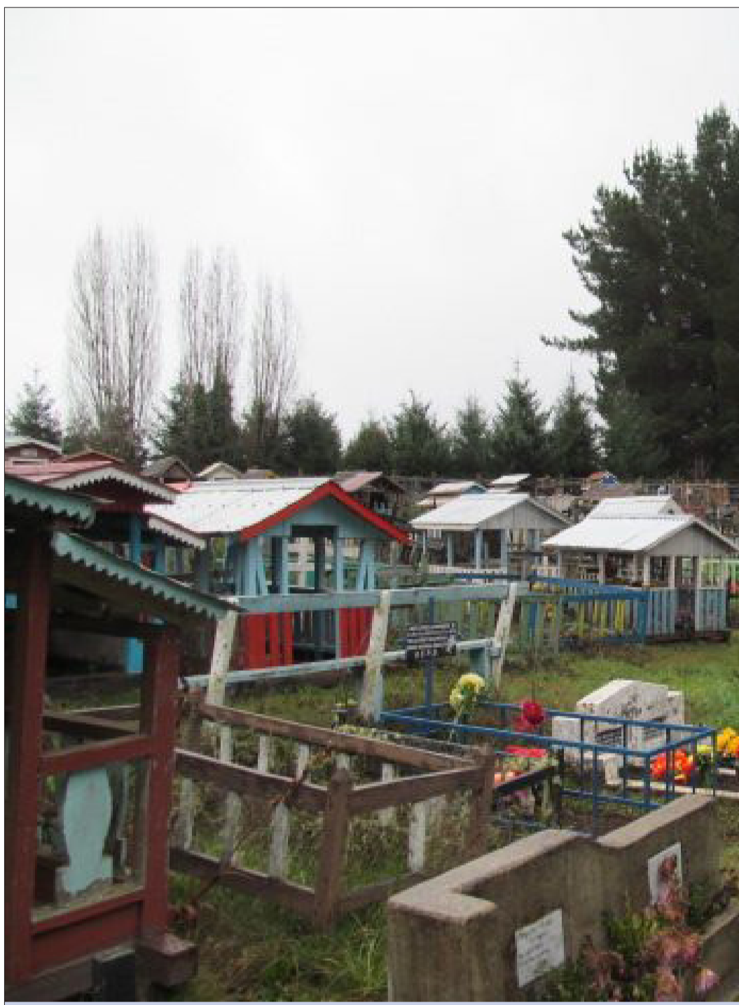
Los mausoleos y tumbas encontradas en el sector buscan asimilarse a una casa con el fin de proteger al difunto de intrusos u otros males

Lo descrito anteriormente da cuenta de un proceso de sincretismo muy significativo, entre nuestra cultura originaria y las influencias del conquistador y su propia herencia cultural, demostrada por cruces, adornos, los mismos diseños de las casas, rejas de madera, tumbas de concreto etc. La misma sepultura en la profundidad de la tierra responden a costumbres cristianas. Este lugar representa el contac-