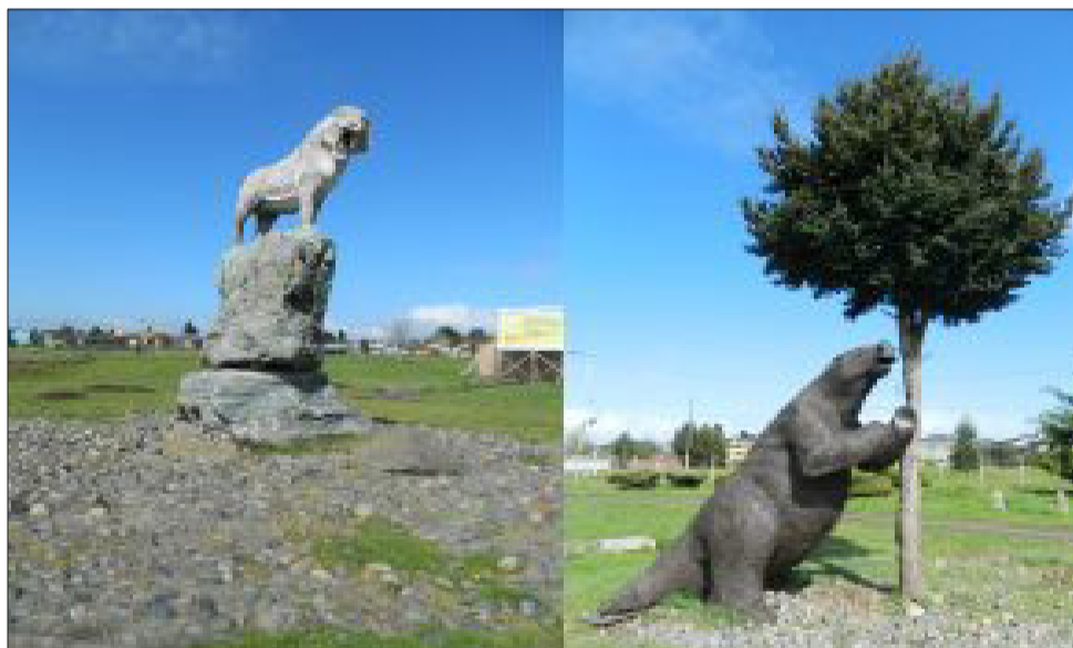
Estatuas ubicadas en el parque frente a la Villa Los Notros, cuna del hallazgo de los restos del Gonfoterio hace décadas atrás.