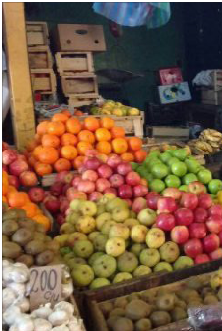
En la Feria Rahue se puede apreciar un sin número de frutas, verduras, carnes, productos lácteos, medicinas naturales, mariscos y pescados.