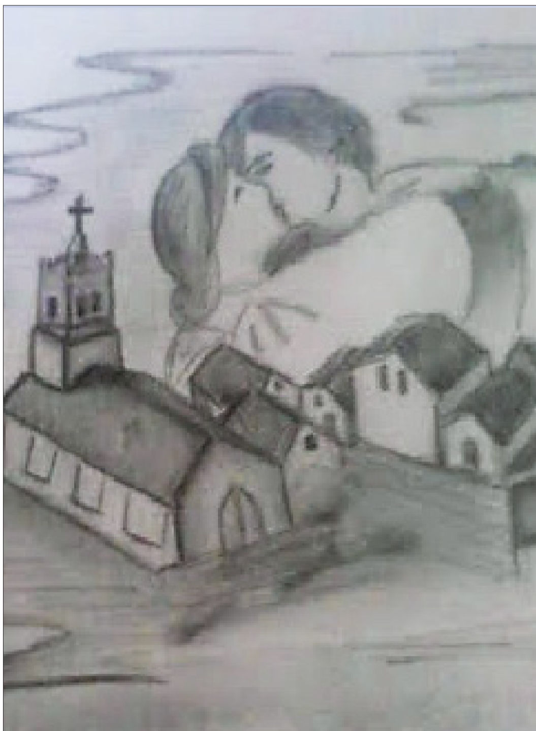
Leyenda de Juan Soldado que explica la camanchaca que se produce en la región generalmente en las mañanas y días fríos.

Estas creencias no solo son importantes en cuanto al cono-