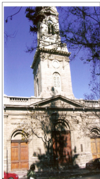
La Catedral de La Serena es una de las iglesias mejores conservadas.

Algunas iglesias como la Catedral de San Bartolomé de La Serena, Iglesia de San Francisco, Iglesia San Agustín, Iglesia “Nuestra Señora de las Mercedes” y la Iglesia de Santo Domingo se mantienen hasta hoy disponibles para todos y en un perfecto estado, una situación no observada en otros lugares en donde no se respetan los templos y otros