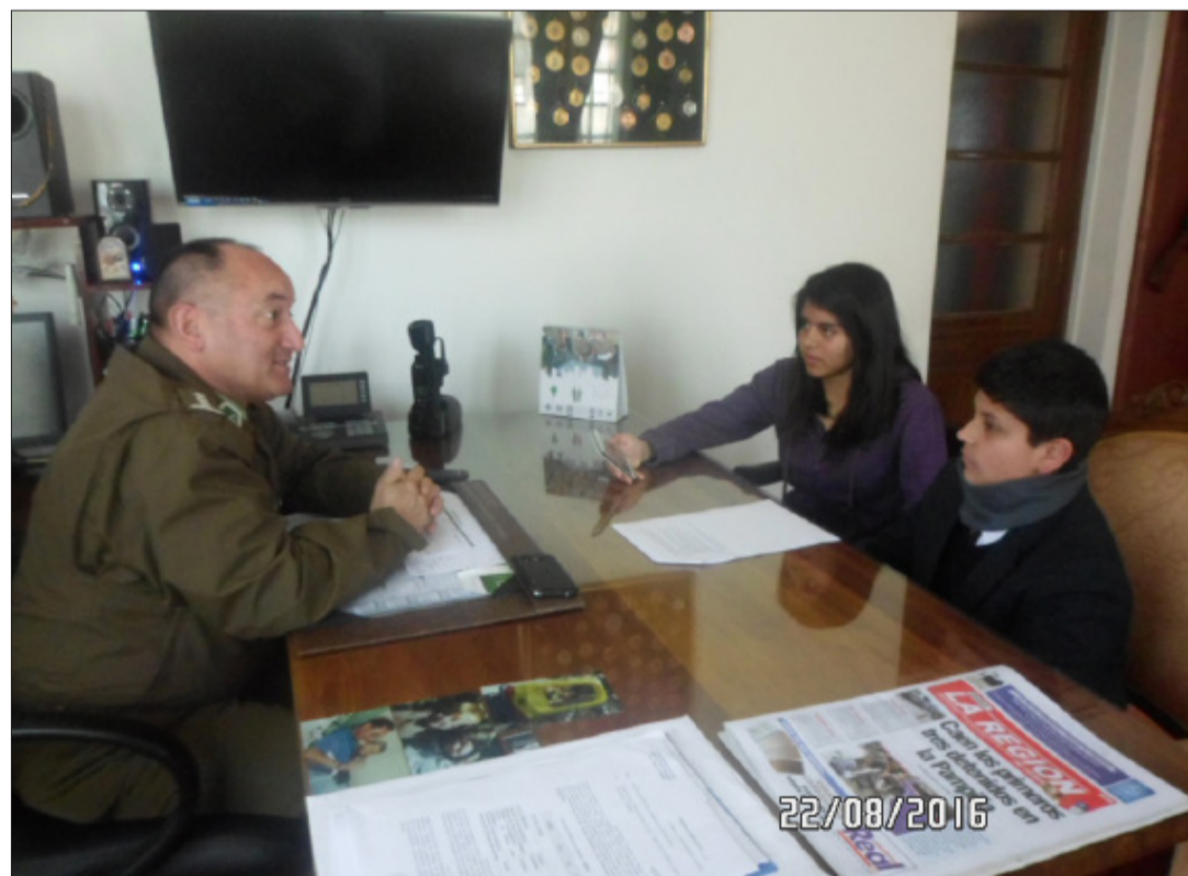
El Coronel de la Provincia del Elqui, Rolando Casanueva de Rosa explica los planes de seguridad la región y la situación de la delincuencia.

das a realizarse de manera pacífica, pero terminan en la destrucción del espacio público o en actos subversivos que alteran el orden público debido a los famosos encapuchados, y cuando carabineros detiene a estos delincuentes, les