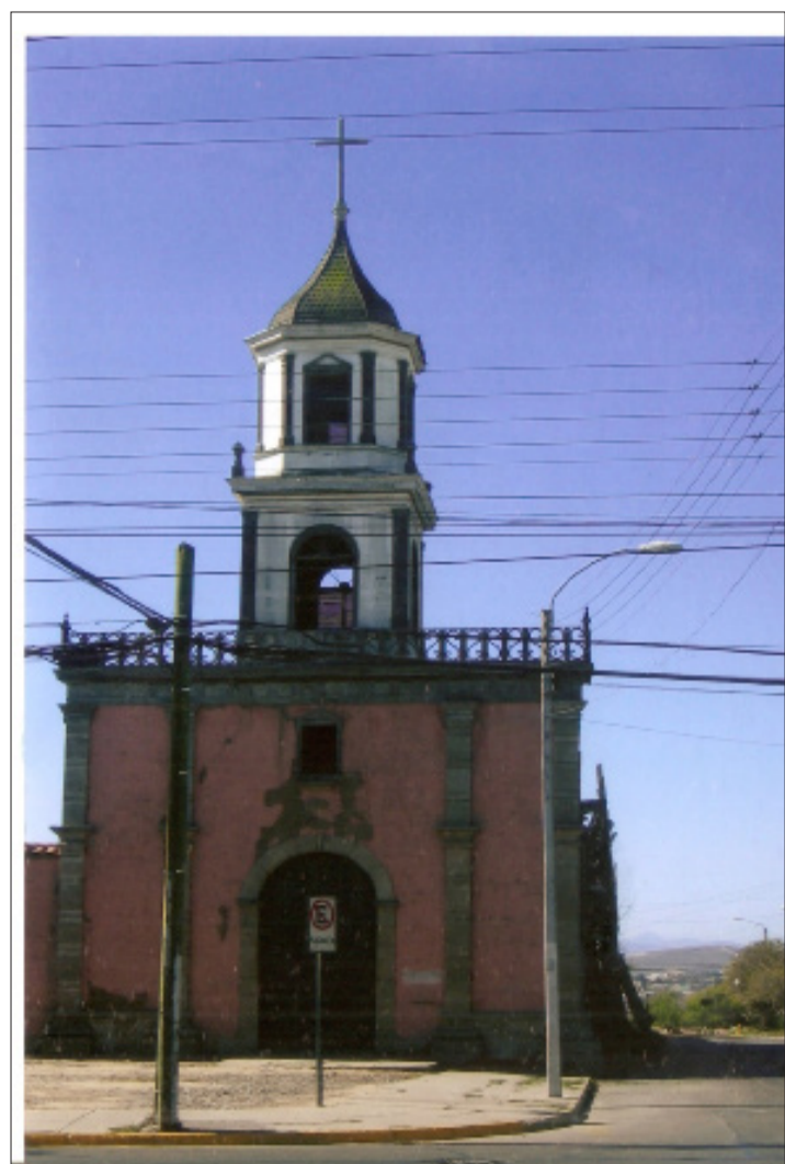
La iglesia Santa Inés es una antigua iglesia que aún se mantiene en pie. Actualmente es un museo que está disponible para todas las personas.

Finalmente, se puede desmentir la creencia popular que habla de los túneles subterráneos que conectaban a las iglesias y que servían para refugiarse de los ataques de piratas que eran bastante comunes.