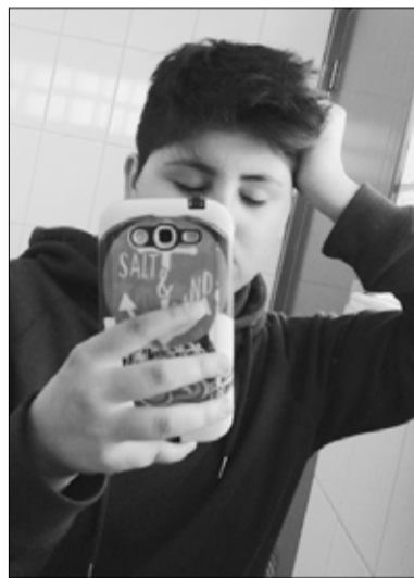
La lucha para el cambio definitivo aún no termina.

que vivir esta incomodidad con mi cuerpo siendo tan joven y pudiendo hacer otras cosas propias a mi edad.