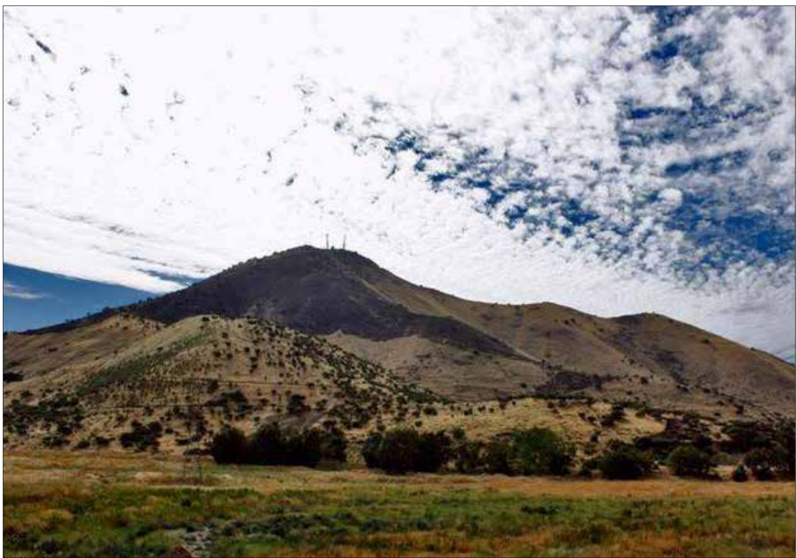
Excavaciones de 1975 arrojaron que en el lugar existía uno de los principales cuarteles de las tropas incaicas. Dos años más tarde, su fortaleza es declarada Monumento Histórico Nacional.