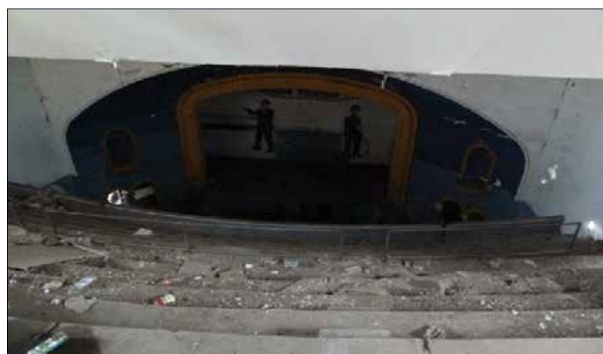
FAN PAGE RECUPEREMOS EL TEATRO