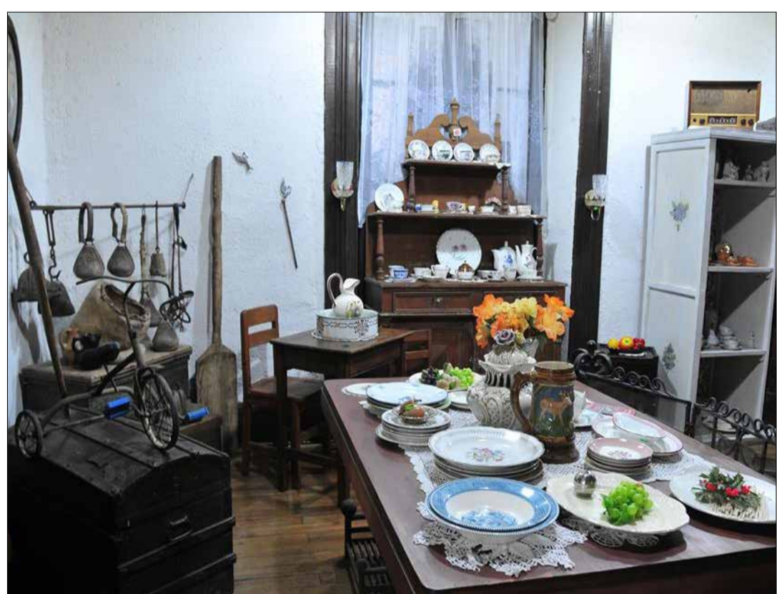
Entre sus historias, circula el mito sobre la conexión que poseía con el hospital parroquial mediante túneles subterráneos.

La Casona de los Sueños, de valor histórico, es un espacio restaurado dedicado para el arte, creación y comercio en el que todos puedan participar o simplemente admirar la vigencia de una construcción del pasado y las huellas de la identidad cultural de esta hermosa comuna.