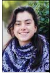
Por Constanza Hidalgo

La historia alberga muchas maravillas, pero con el pasar de los años, la inconsciencia produce destrucción y las maravillas se transforman en efímeros recuerdos que denotan el triste olvido de las personas por lo que ya no sirve.