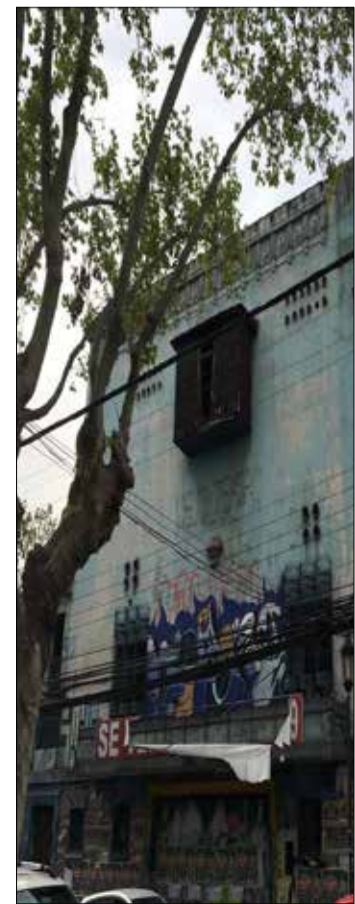
El edificio espera por algún comprador.

En el municipio planean conseguir fondos con la Gobernación Regional y el Consejo de Cultura. “Durante años, hemos manifestado crear escritos para hacer un proyecto y presentarlo a distintos fondos concursables, pero la burocracia y urgencia de otros temas, desplazan constantemente la idea”, señalan desde el departamento de Cultura de la Municipalidad.