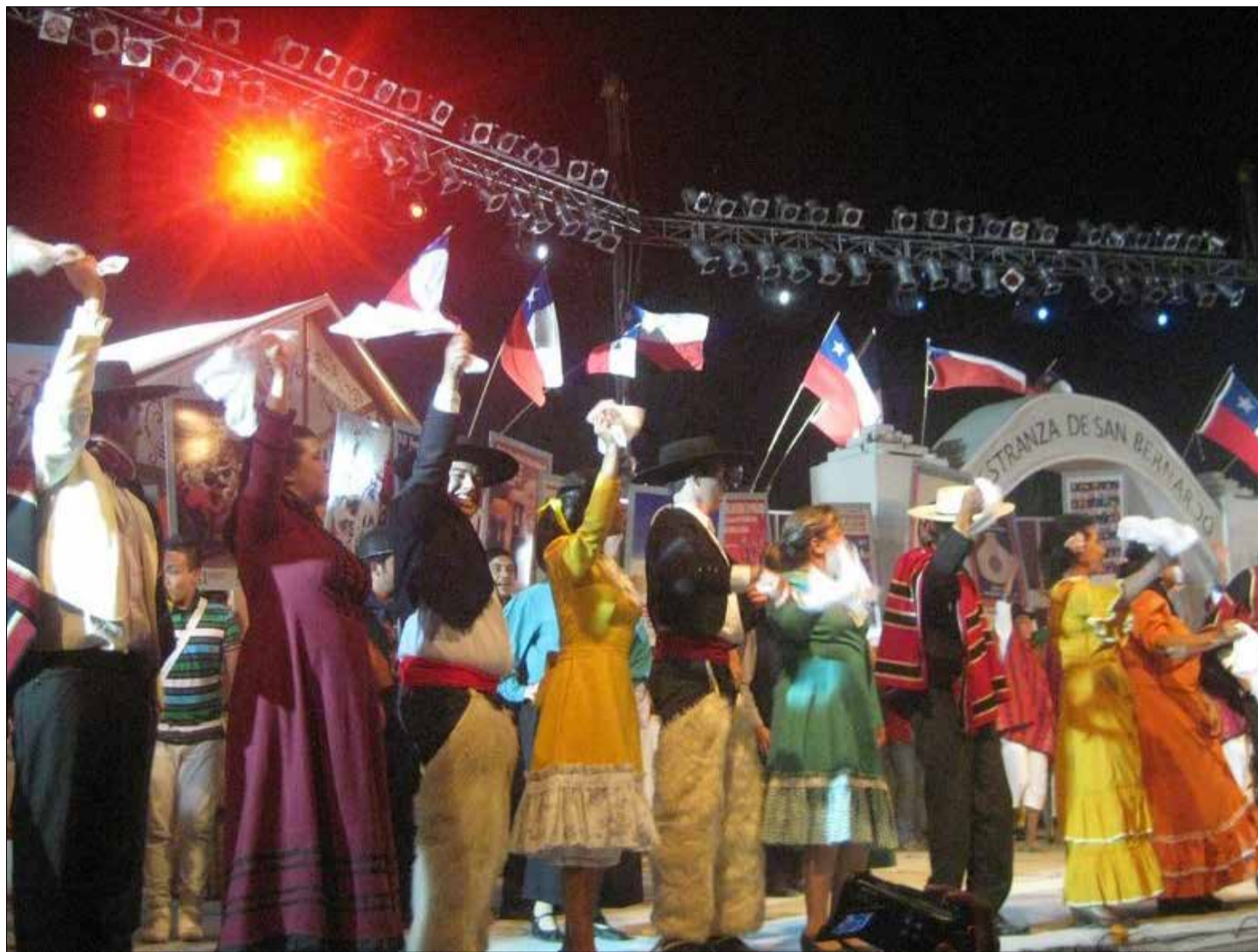
El Festival Nacional del Folclore es un evento considerado un orgullo para toda la comunidad y donde participan artistas de diversas localidades del país.

En 1960, entre los dirigentes de la Confederación Nacional de Conjuntos Folclóricos y aficionados a las obras musicales chilenas se discutía con entusiasmo la necesidad de celebrar un homenaje a los partidarios de la música nacional. Surgió la idea de organizar un Festival temático al respecto. Así fue como se celebró la primera exhibición de folclore Talagante en 1968. No obstante lo anterior, para darle mayor énfasis, importancia y relevancia artística, la confederación resolvió que el lugar más propicio y con mayor disposición y entusiasmo de las autoridades de la época era la comuna de San Bernardo, realizando en 1972 el Primer Festival Nacional de Folclore propio. Luego, en 1975, nace la Feria Nacional de Artesanía Tradicional, fecha desde la cual se siguen exhibiendo productos de distintos materiales con origen principalmente chilenos y latinoamericanos. Más tarde, en 1996 se agrega la Feria Gastronómica, donde se exhiben puestos con gran variedad de comida típica