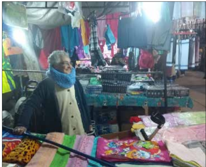
Por el persa han pasado generaciones completas. Los pequeños del ayer soy hoy los más experimentados, verdaderos tesoros vivos del icónico mercado de San Bernardo.

“El trabajo siempre es duro, pero con ímpetu y hartito sacrificio se puede salir adelante. Es cuestión de tener ganas y saber atender. Los clientes que vienen por primera vez quedan conformes y eso permite que vuelvan cuando lo necesiten y, además,