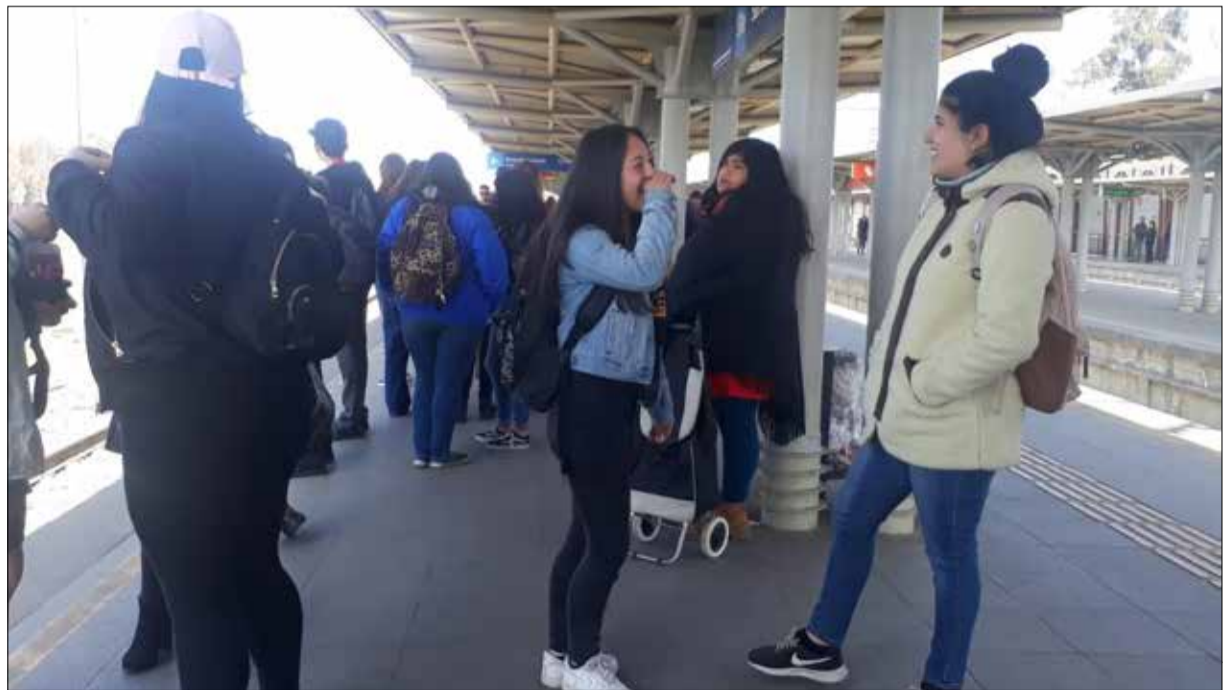
Los andenes de la estación prácticamente no poseen butacas gracias a los mínimos tiempos de espera, permitiendo un flujo más expedito en los usuarios.

Alternativas de pago mediante tarjeta Bip con una tarifa integrada y un servicio con capacidad de 84 pasajeros sentados, 12 de ellos exclusivos para personas con discapacidad y otros 426 de pie y aire acondicionado. Cambios