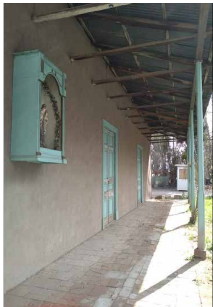
Sus antiguas murallas y estructura mantienen parte importante de la historia de la comuna.

"Este combate y triunfo de los Carrera produjo un asombro colectivo y sensación de enfrentamiento entre los bandos hermanos, dado que representaban al país pero que inesperadamente tuvo un giro, porque sin haberlo planeado y tras el ingreso de las tropas españolas a territorio nacional, se juntaron para defender a