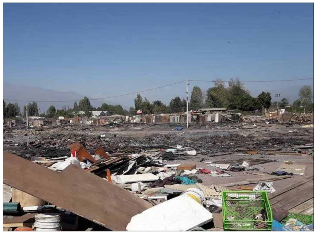
Por casi medio siglo, el campamento fue símbolo de abandono social, hoy es un reflejo que todo esfuerzo trae consigo recompensas.

El municipio hace años que está trabajando para erradicar el campamento y el basurero clandestino que existe en sus entornos, y que hoy tiene al fin solución. A esto se suma el trabajo conjunto realizado por privados y Levantemos Chile, que ayudó a reconvertir, limpiar y crear el centro de especialidades en salud con salas cunas y un nuevo consultorio en El Manzano, permitiendo así, que el sector donde se emplazaba el Campamento San Francisco, siguiera el mismo destino.