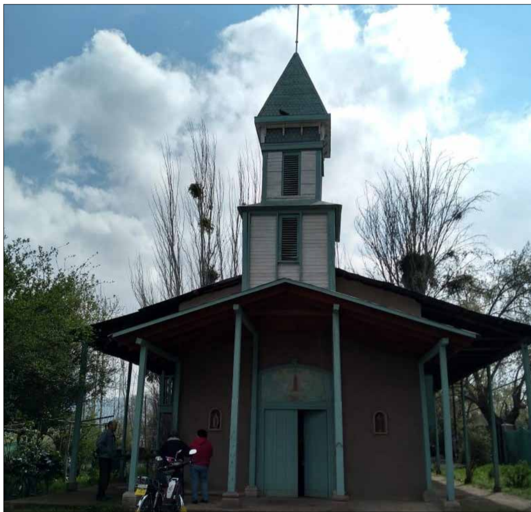
El lugar contiene la capilla más antigua de San Bernardo y registra diariamente visitas de fieles quienes piden por los residentes y el cuidado del sector.

Los libros exponen que el día 26 de agosto de 1814, las tropas de Bernardo O'Higgins cruzaron