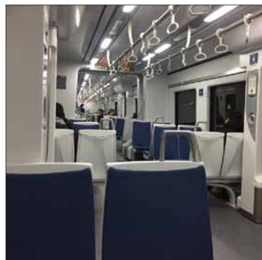
Gracias a la mayor frecuencia del servicio, los pasajeros pueden viajar cómodamente sentados debido a la disponibilidad de asientos que existe en los vagones.