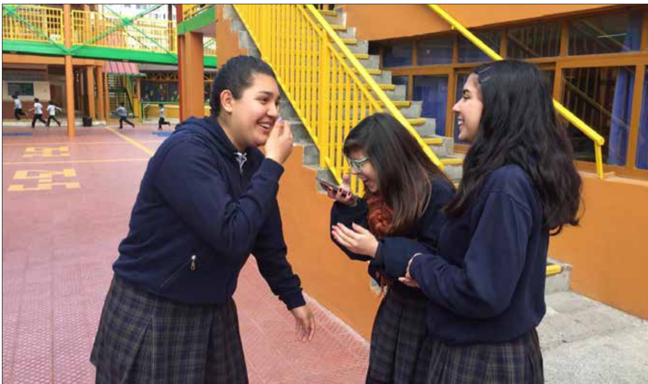
La estudiante reconoce que todo es posible, sin importar los tropiezos o errores, porque depende de uno mirar la vida con optimismo.

Una joven de 17 años, perteneciente a los cientos de casos de embarazo adolescente que hay en Chile y que, a la vez, representa a esa pequeña fracción de mujeres que siguen estudiando pese a ser madres a temprana edad.