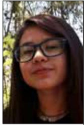
Por Almendra Salazar

La tradición familiar de mis padres comprende que todos los domingos, al tratarse de un día de descanso, tenemos que visitar algún recinto natural en el cual podamos andar en bicicleta, comer asado, dormir una siesta y hasta beber mate al atardecer.