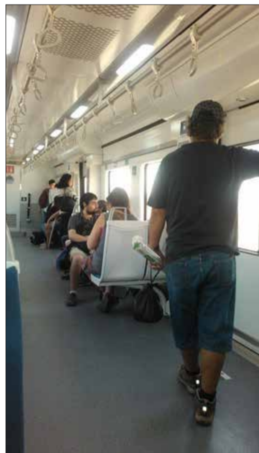
Incluso en horarios punta, lo espacioso de los vagones permite que los pasajeros no viajen hacinados como en otros tipos de transportes públicos.

La feria persa funciona los días sábado, domingo y festivos, desde las 10.00 a 20.30 horas en horario de invierno, y de las 10.00 a las 22.00 horas en horario de verano. Sin perjuicio de lo anterior, para los días festivos, las festividades patrias y de fin de año, el municipio puede establecer modificar los días y horas de funcionamiento.