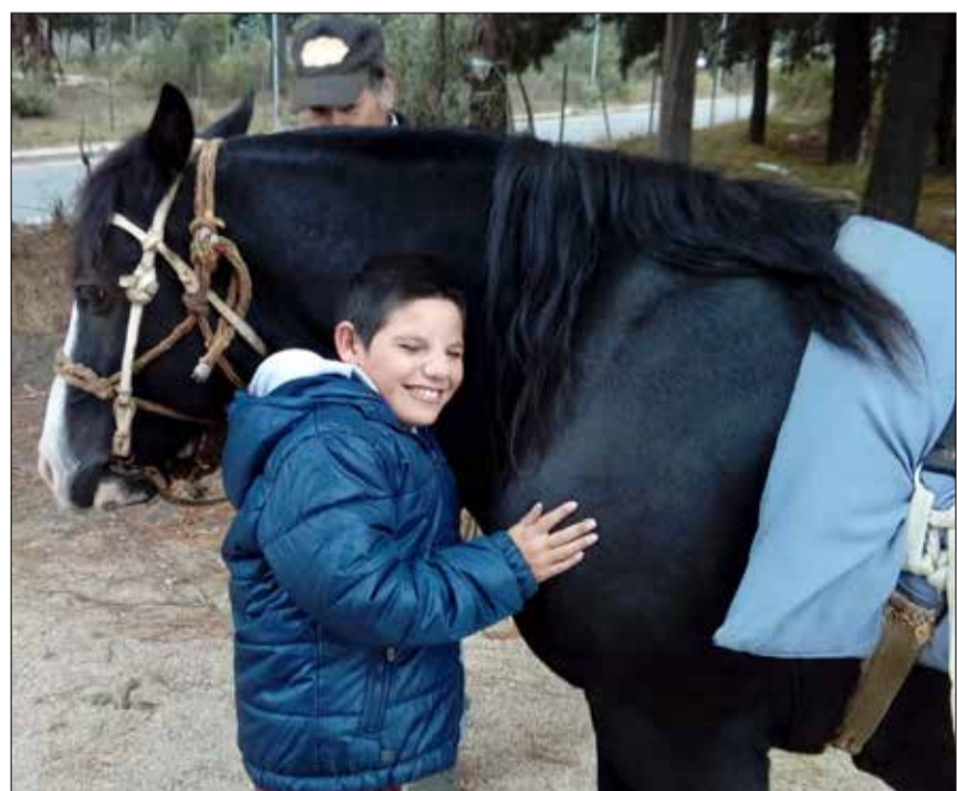
Alumno en una de las clases de Hipoterapia que imparte la Escuela Villa Jesús, guiada por el kinesiólogo de dicho establecimiento.