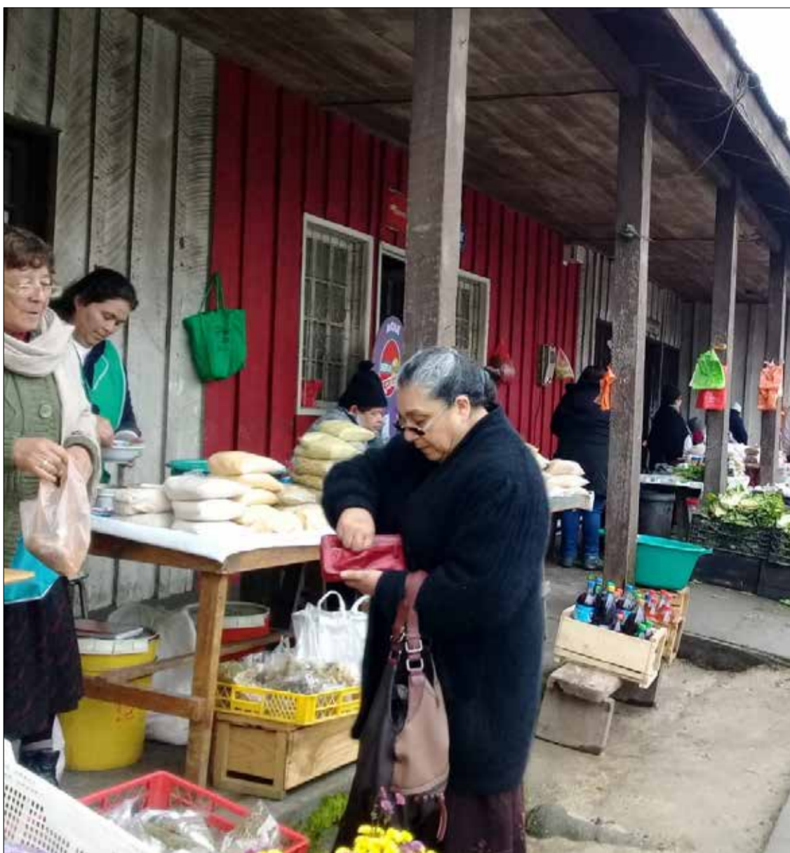
DIARIO ECOS DE LA TIERRA

Frente al hospital de la comuna se encuentran varios agricultores que venden diversos productos orgánicos.