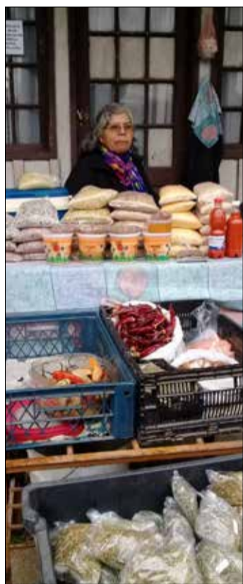
Feria campesina ubicada en las afueras de las oficinas del antiguo correo de Coelemu donde cientos de personas adquieren sus productos saludables de todo tipo.

A pesar de ello, el comunicador piensa que las condiciones del lugar deberían mejorarse, sobre