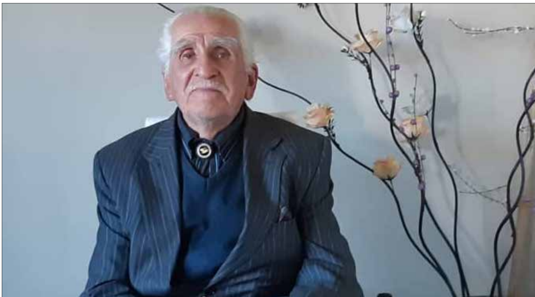
El bombero insigne más antiguo de la comuna, destacado por su labor de voluntario de la segunda compañía de Coelemu por más de 55 años.