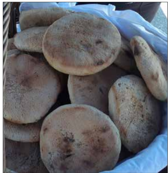
Un tradicional canasto con tortillas de rescoldo, preparadas por mujeres de Coelemu.

EXISTEN DOS VERSIONES del origen de las tortillas de rescoldo: algunos aseguran que vienen de España, donde recibían el nombre de "pan subcinericio" y otros dicen que derivan de la cocina mapuche, desde la época de la Conquista.