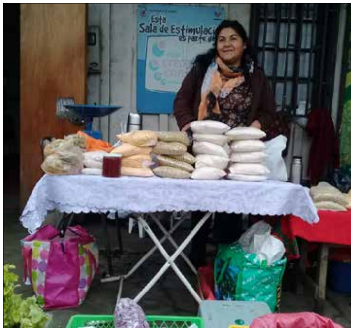
Una de las agricultoras de la Feria Campesina de la comuna de Coelemu ofreciendo variedad de alimentos orgánicos no intervenidos y de calidad.