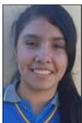
Por: Norma Coronado

Este año me inscribí en varios talleres extraescolares que imparte el establecimiento en el que estudio, me da cuenta que había una gran cantidad de ellos para todos los gustos y niveles. Le conté a mi madre sobre esto y me contó que antiguamente no existía la posibilidad de participar de forma gratuita o tener acceso a actividades de ese tipo, supongo que se debe a los grandes cambios a los que se ha enfrentado nuestra sociedad y pienso que es una excelente oportunidad para explotar nuestras habilidades artísticas o deportivas, así como una instancia para descubrir talentos y futuras profesiones u oficios.