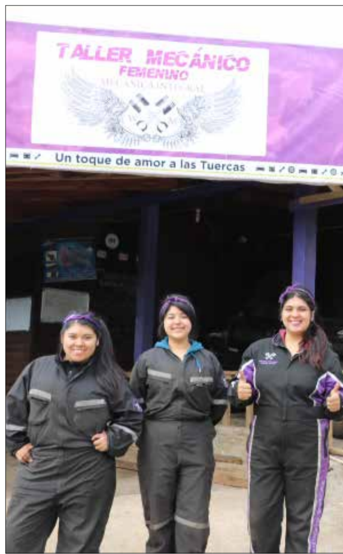
Integrantes del taller mecánico WM han concedido entrevistas a diferentes medios de comunicación, tanto a nivel nacional como internacional.

Por otra parte, reconoce que "las formas como hemos organizado nuestra sociedad y las relaciones de género han influido en esta segmentación de las mujeres en el espacio