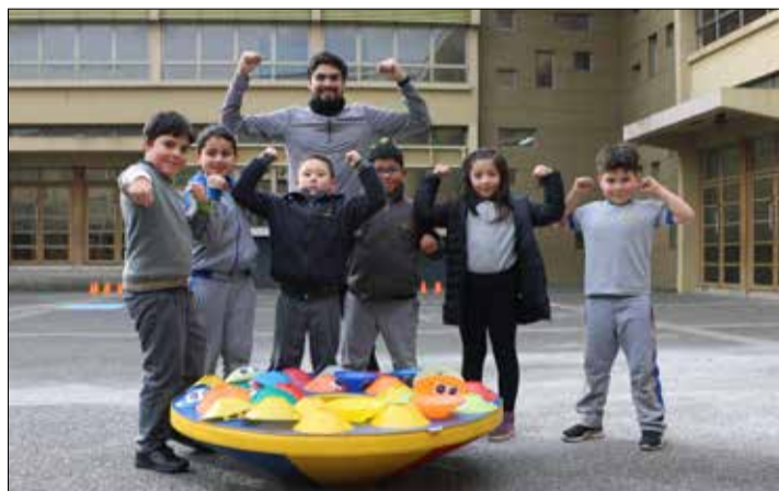
Estudiantes de esta comunidad escolar son parte del plan que combate desde temprana edad los altos índices de sobrepeso y obesidad.