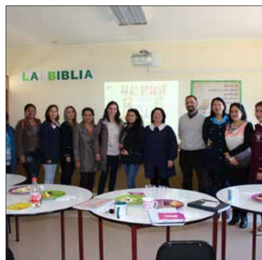
El equipo que trabaja la integración de estudiantes extranjeros en una actividad especial.