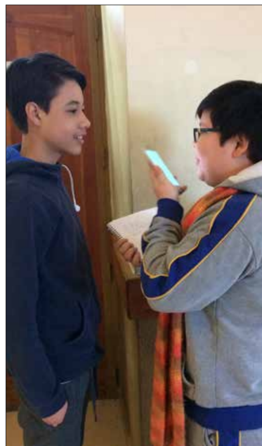
Estudiante entrevista a alumno oriundo de Venezuela, y hablan sobre la buena recepción que tuvieron sus profesores y compañeros cuando llegó a la escuela.

Estos proyectos de negocios, aportan a que las mujeres se desarrollen en ámbitos laborales, que anteriormente se segmentaban al trabajo masculino, como la producción de hortalizas, crianza de animales menores, apicultura, agricultura orgánica, artesanía, entre otras áreas.