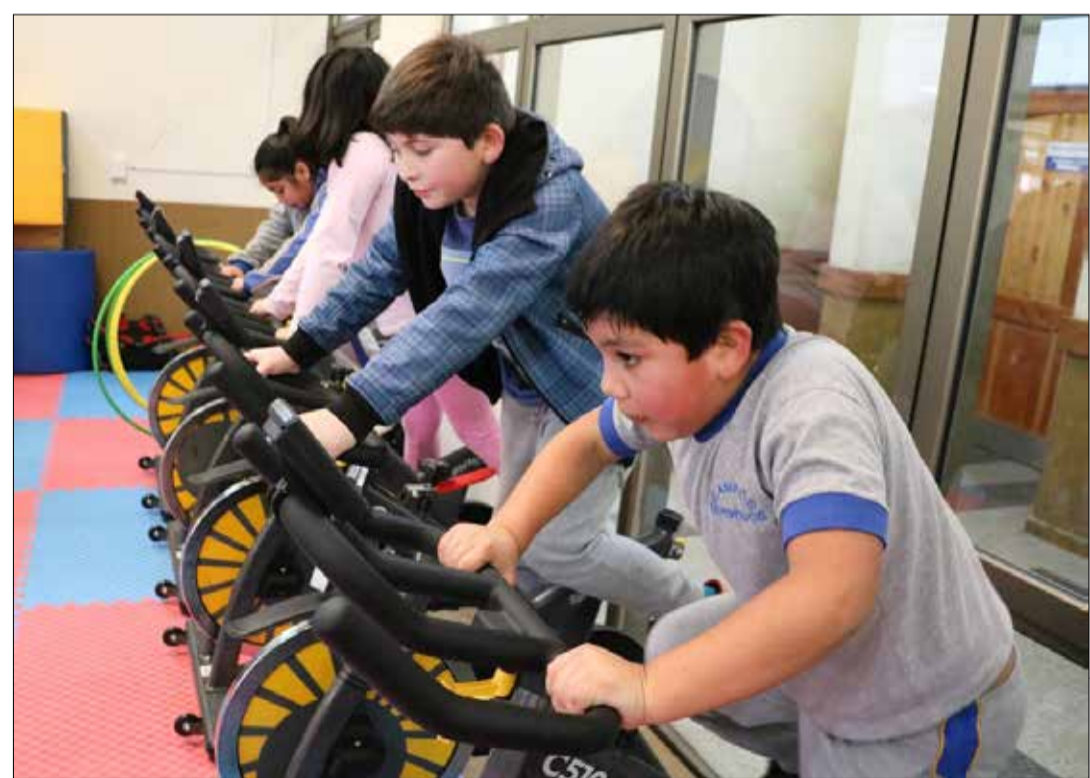
Estudiantes pertenecientes al Plan realizan ejercicios en las bicicletas estáticas que están instaladas en la sala de motricidad del establecimiento.

Los profesionales a cargo del plan en esta escuela son Cristian