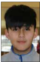
Por: Néelson Nahuelhuen Curiqueo

Al caminar por mi escuela, veo a varios estudiantes de diferentes cursos recorriendo los pasillos con parlantes en sus hombros escuchando canciones con un ritmo llamativo. La música que escuchan se llama trap. Debo reconocer que más de alguna vez he tarareado sus letras, pero un día me dediqué a escuchar detenidamente lo que dicen.