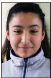
Por: Colomba Troncoso

Para la mayoría de las personas que vivimos en Temuco y sus alrededores, no olvidaremos el 20 de abril de 2016; día en que se destruyó por completo el Mercado Municipal, donde un voraz incendio quemó a este principal centro Turístico. El Mercado era un lugar emblemático de la ciudad, se podía disfrutar de apetitosos almuerzos, artesanía mapuche, abastecedor de carnes, vegetales y mariscos.