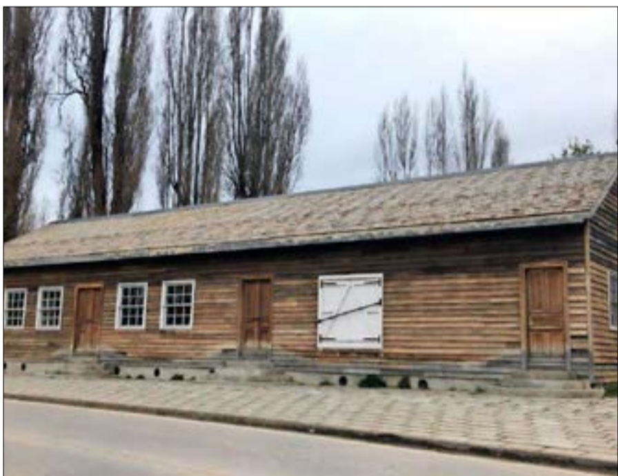
El espacio cultural consta de una arquitectura basada en la restauración de distintos monumentos, cuyos detalles intenta siempre conservar.