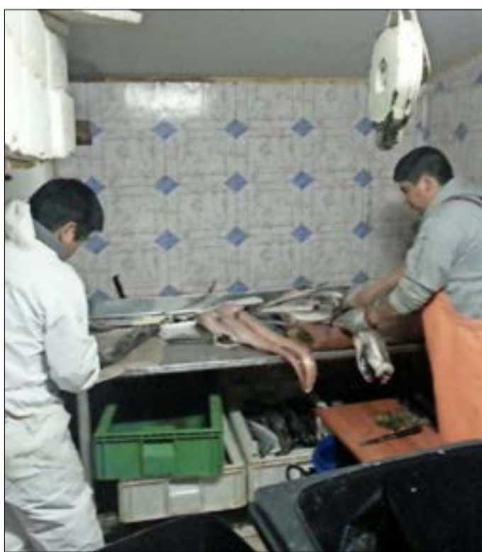
Dos pescadores artesanales de Puerto Cisnes preparan sus productos, entre los que se encuentran merluzas, congrios y róbalo, para venta y consumo.