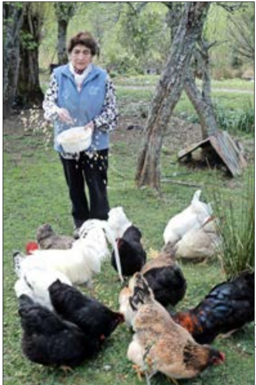
Alimentando a sus gallinas en el patio de su casa de El Balseo, Puerto Aysén.