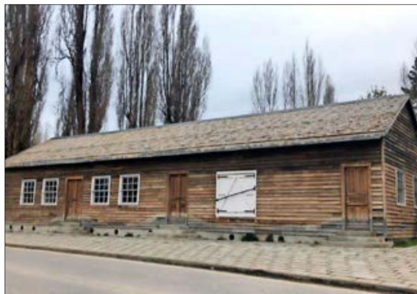
Pulpería restaurada por el Museo Regional de Aysén.

Desde su apertura, cerca de 10 mil personas han asistido a ver las diversas muestras, permanentes e itinerantes, que