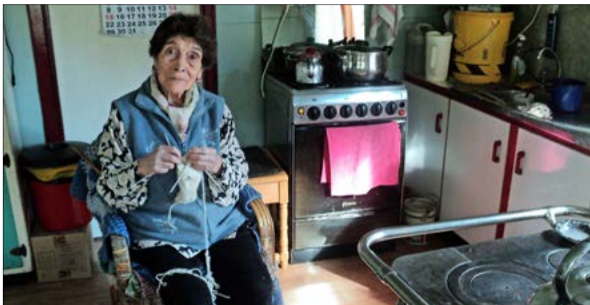
Tejiendo junto a la cocina de leña, en su casa ubicada en la ruta Aysén-Coyhaique.

¿Cómo fue tener a sus hijos en una zona tan aislada de los centros urbanos? Tuve a mis hijos con ayuda de una partera, nunca tuvimos complicaciones, pero cuando ella no se encontraba, teníamos que recibir la ayuda de nuestros maridos. Nuestras vidas