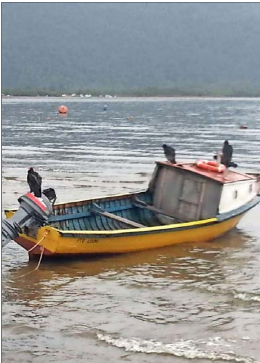
Embarcaciones utilizadas por pescadores artesanales en el litoral de Puerto Aysén, preparadas para zarpar rumbo a la zona de extracción de recursos.

“Actualmente, en Puerto Aguirre (localidad del litoral sur de Islas Huichas, comuna de Aysén) existen 12 sindicatos, una gran cantidad para una comunidad de pesca tan pequeña. Eso muestra que no se alcanzan acuerdos, que no