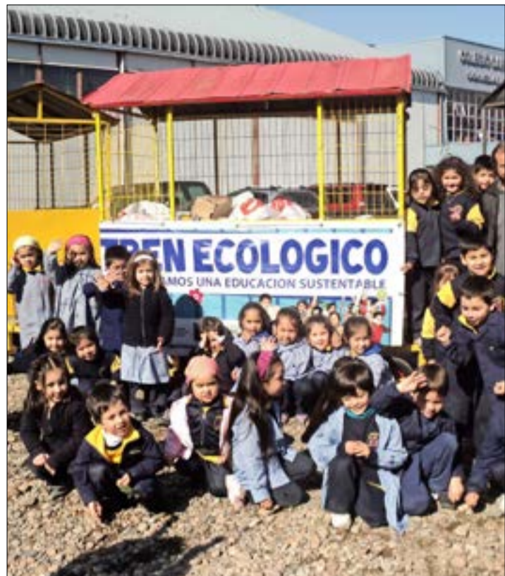
Alumnos de enseñanza básica del Colegio Santa Teresa de Los Andes reúnen desechos para reciclar.