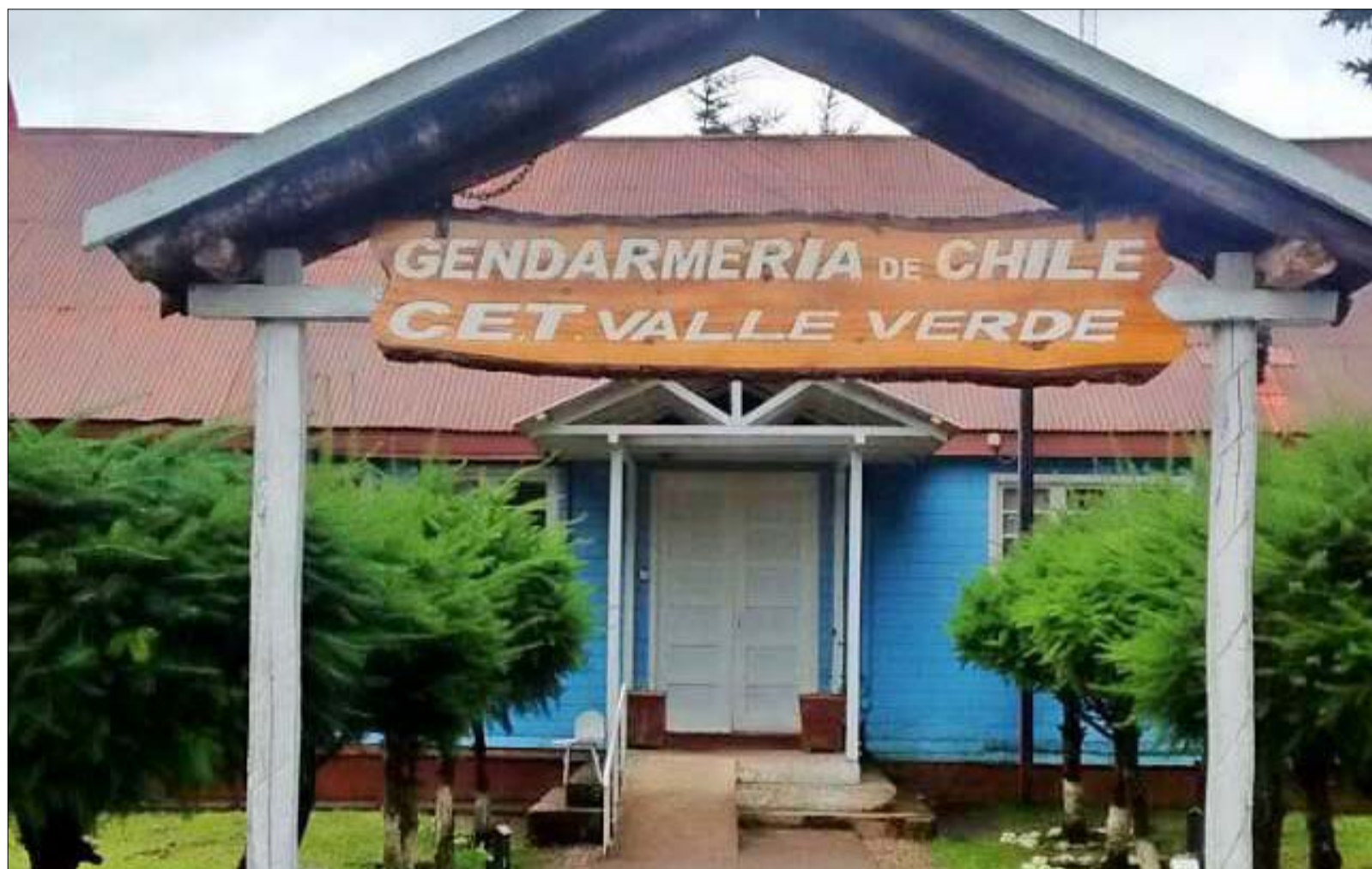
Fachada del Centro de Estudios y Trabajo Valle Verde, ubicado en el kilómetro 10 del Camino Aysén-Coyhaique.

Esta iniciativa comenzó con un trabajo realizado por el Centro de Excelencia en Geotermia de los Andes (CEGA) en el año 2015, cuando se llevó a cabo una toma de muestras y una serie de mediciones geológicas. Los resultados del estudio permitieron generar un mapa de calor del subsuelo de la zona aysenina, fijando los distintos usos que cada lugar podía