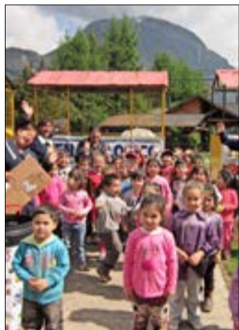
Alumnos de educación preescolar del Jardín infantil Bambin Gesu, junto a sus educadoras, participan de la recolección de residuos del “Trencito ecológico”.

de Protección Ambiental, se financió la construcción formal de los puntos limpios. Dos años después, con otro proyecto adjudicado, instalaron lombricerías en los colegios para disminuir los desechos orgánicos.