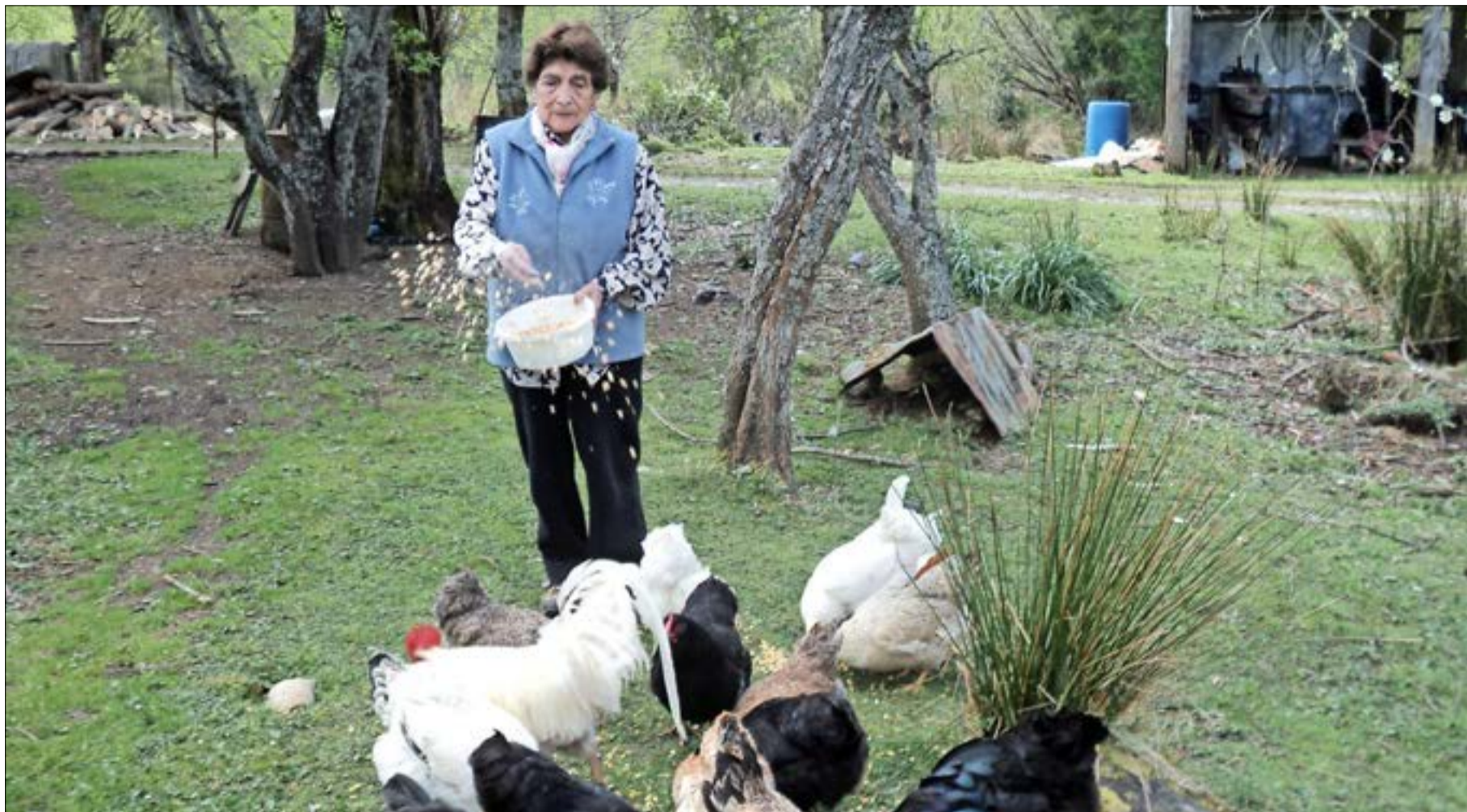
Alimentando a las gallinas en el patio de su casa, una actividad que entretiene sus días.