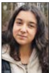
Por: Emilia Paz Pérez Vega

Curso segundo año medio y con 16 años ya cambia el foco del estudio hacia la PSU. Comienzan las preguntas "¿y qué vas a estudiar cuando salgas?" "¿Cómo te estás preparando para la PSU?" "¿Dónde quieres estudiar?". Y con eso también llega la presión de elegir una carrera y tomar las decisiones que definirán el futuro.