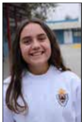
Por: Loredana Baldessari Araya

Una compañera contaba durante la clase de música lo hermoso que le había resultado ir a presenciar al Ballet Folclórico Nacional (Bafochi) en Santiago, mientras la escuchaba, me preguntaba, ¿En nuestra región no habrá talentos de esta naturaleza? Entonces