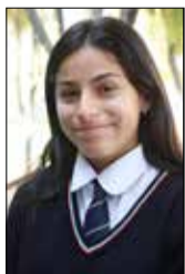
Por: Martina Silva Campusano

En el metro de Santiago un estudiante salta el torniquete, como diría mi profesor de física, es el principio del efecto mariposa, jamás pensé que esa atlética acción generaría acciones inconmensurables en el resto del país, su sola decisión de no pagar su pasaje