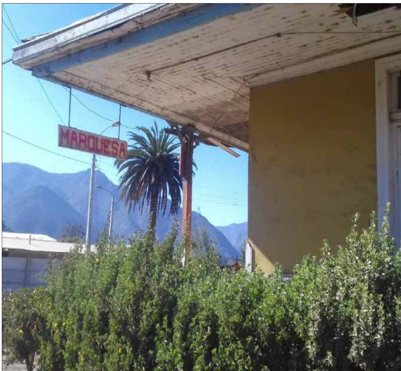
ANTIGUA ESTACIÓN FERROVIARIA DEL PUEBLO DE MARQUESA, parada obligada del antiguo tren de pasajeros del Valle de Elqui. El actual proyecto de reactivación contempla llegar hasta aquí al comienzo.

EL PLAN contempla que en la primera etapa el tren llegue hasta Marquesa. Es un proyecto importante que se debe fortalecer.