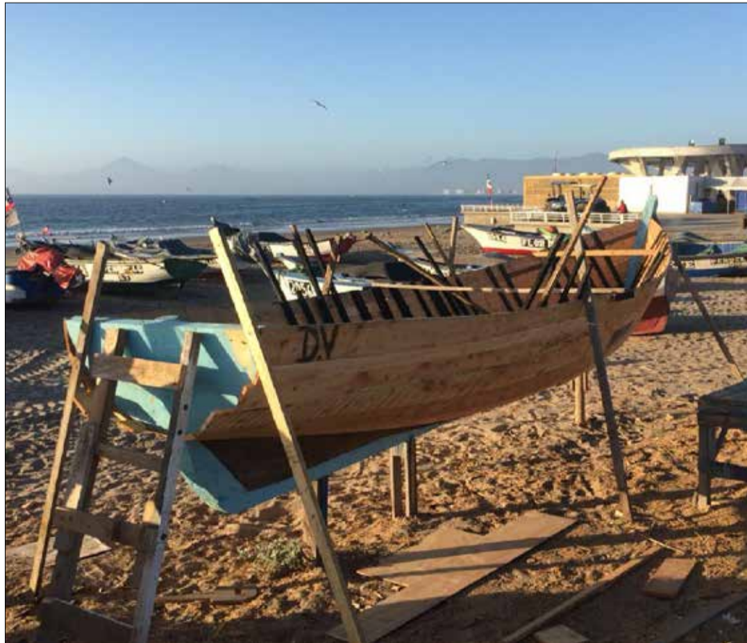
LA CONSTRUCCIÓN DE EMBARCACIONES DE MADERA es un oficio que cada día amenaza con desaparecer. En una época fue fundamental para la economía regional, hoy quedan pocos artesanos dedicados a esta labor.

“Uno se siente muy satisfecho de hacer una buena embarcación. Empezábamos con un palo cualquiera a hacer la quilla, que es como la columna vertebral, y luego, verlo terminado después de un mes de faena, era como sentir que nacía un hijo. Lo hacíamos bien porque sabíamos que allí irían vidas de hombres que se ganarían el sustento en el mar”,